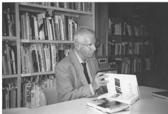
Alexander Walker à la Cineteca del Friuli, Gemona août 2000

Alexander Walker, l'un des critiques et historiens anglo-saxons les plus influents de l'après-Deuxième Guerre, avait rendu visite à trois reprises à la Cineteca del Friuli (CF) de Gemona, entre 2000 et 2002, pour trois conférences. Il avait raconté, entre autres, les souvenirs émouvants de son ami Stanley Kubrick, rencontré et interviewé à Manhattan en 1957. Et avait évoqué la cérémonie de son enterrement, le 12 mars 1999, à l'intérieur du