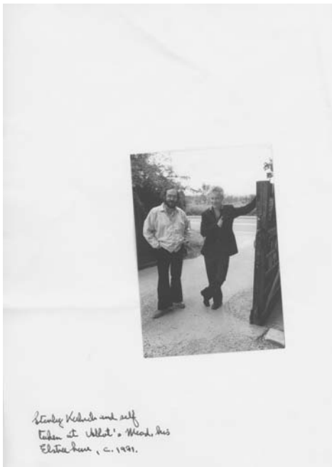
Stanley Kubrick et Alexander Walker en 1971, avec une inscription de Walker.