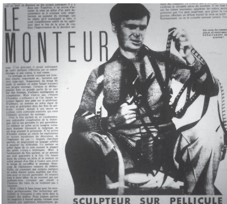
Illustration de l'article de Louis Chavance, « le monteur, sculpteur sur pellicule », Cinémonde , n° 450, 4 juin 1937, p. 509.

beau temps pour les monteurs professionnels. Nous jouions parfois au magicien à chapeau pointu, lorsque nous voyons nos supérieurs hiérarchiques patauger dans le “synchronisme” et les “moviolas” qui semblaient alors des mystères bien impénétrables. [...] On peut comparer le monteur au sculpteur qui modèle la pellicule, au musicien qui rythme les images... ou à la couturière qui assemble des morceaux d'étoffe» 81 . Entre artiste et artisan se dessine une figure à part du cinéma, soulignée également par Jacqueline Lenoir dans Cinémonde en 1934: «Encore un responsable. De son intelligence, de la liberté qu'on lui donnera, dépendra le résultat final. Il peut, s'il le veut, d'un mauvais film faire une réalisation meilleure. Couper ici, rogner là. Écouter ce texte fade, précipiter l'action. Et il peut aussi, d'un bon film, faire une production mortellement ennuyeuse. Ce n'est pas par caprice. C'est une question de capacités» 82 . Ceci a pour effet quasi immédiat de voir pour la première fois les noms des monteurs réellement mis en valeur; si leur nom est plus rare que celui de l'ingénieur du son, cette tendance va quand même s'accélérer durant toute la décennie 1930. Le «Chirat», pour les longs métrages de la période 1929-1939 83 , est riche d'informations (plus fiables sur cette période