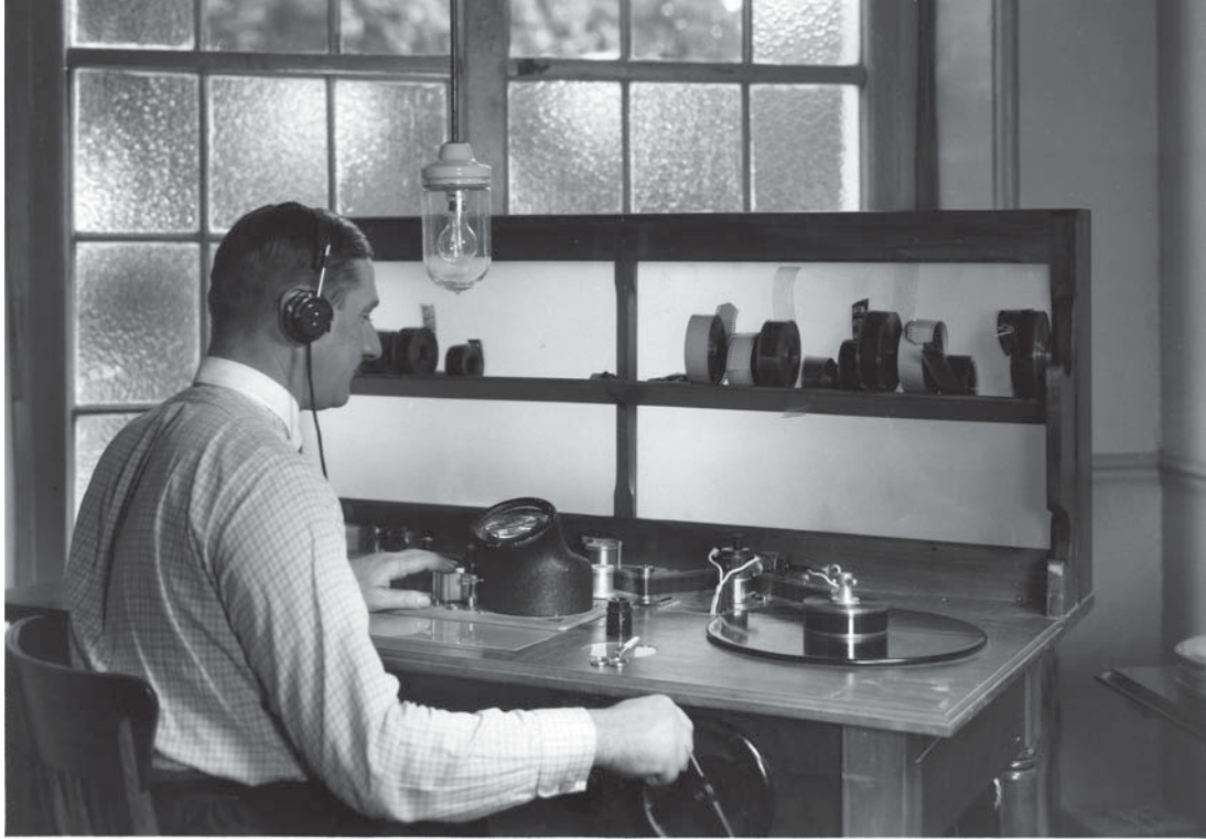
Un monteur de son au travail aux Studios Tobis d'Épinay, s.d. – Films sonores Tobis.

les tables de montage vont se perfectionner, avec des doubles plateaux horizontaux et de grands écrans de contrôle, de fabrication souvent allemande (on voit par exemple dans Cinéa en 1929 deux monteuses travaillant dans de confortables conditions dans une salle Tobis) et vont révolutionner les conditions de travail pour les monteurs, ainsi que leur visibilité. Toutefois, il est vrai que les opérateurs apparaîtront bien plus tôt dans les génériques que les monteurs 66 . Cette invisibilité (qui persiste encore aujourd'hui 67 ) est sans doute à mettre sur le compte du désir d'auteurialité des metteurs en scène, pour lesquels le