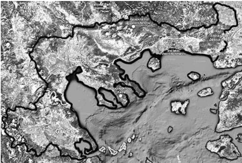
Fig. 1. Le croissant nord égéen

comporte trois régions : la Thessalie, la Macédoine et la Thrace, incluant les îles de Thasos et de Samothrace. La période étudiée, quant à elle, débute au VII e siècle avant notre ère, début de l'occupation grecque des territoires thrace et macédonien, et s'achève à la bataille de Pydna, en 168 avant JC, qui a entraîné l'abolition du royaume de Macédoine et la soumission du reste de la Grèce au peuple romain. Cet intervalle symbolise une ère de mutations politiques, culturelles et artisanales du nord de l'Égée, résultant de la colonisation grecque de ces régions anciennement morcelées et peuplées par des tribus indigènes. C'est ainsi que l'artisanat nord-égéen se développe et se métamorphose au contact de la population grecque.