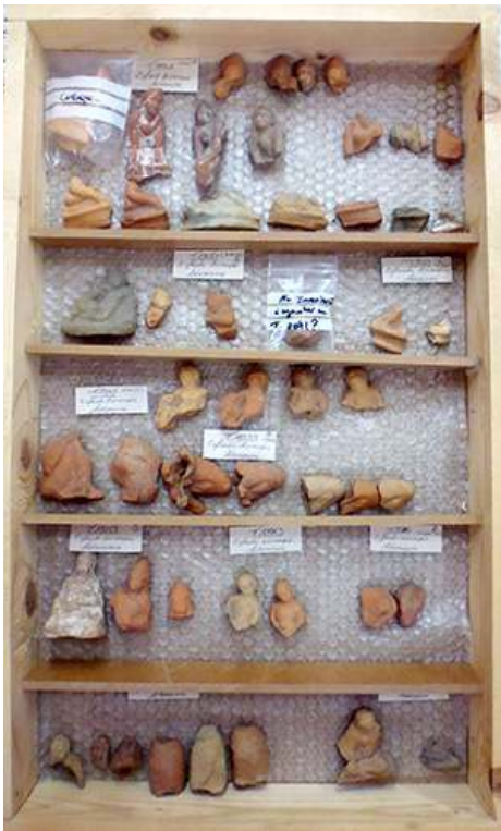
Fig. 4. Garçons accroupis de l'Artémision de Thasos