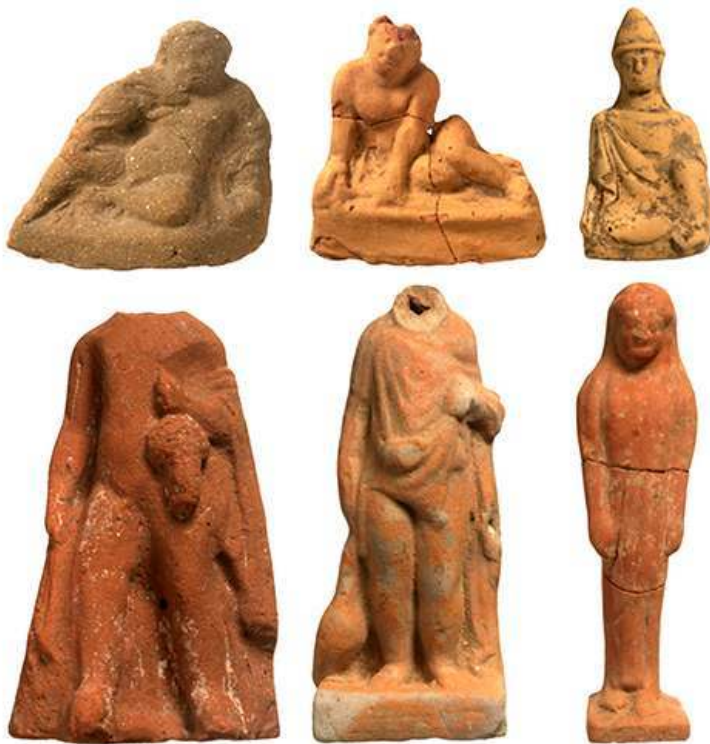
Fig. 5. Figurines masculines des sanctuaires de Thasos