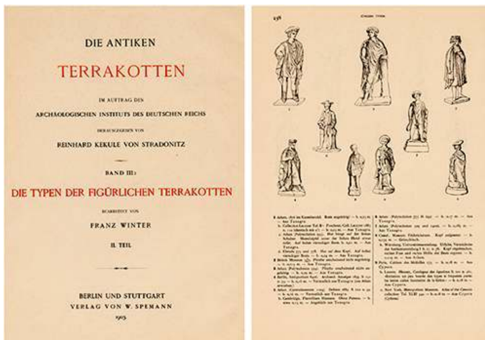
Fig. 3. F. Winter, Die Typen der figürlichen Terrakotten II , Berlin-Stuttgart 1903.

Extrait du Die Typen der figürlichen Terrakotten I