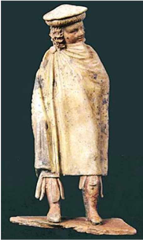
Fig. 7. Garçon à la causia (tombe d'enfant, nécropole Sud de Pydna)

Photo : Deschamps-Lequin 2011, 388, fig.77