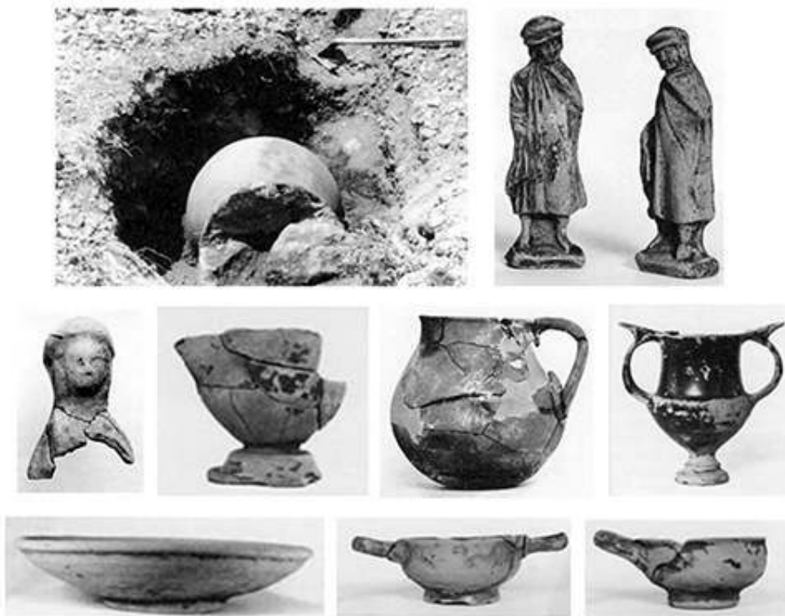
Fig. 6. Mobilier provenant d'une tombe de la nécropole H à Samothrace (inhumation d'enfant)