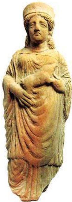
Fig. 2. Un esemplare di offerente di porcellino (tipo XVIII) dal santuario

standardizzazione, caratteristica questa ancora più evidente nell'ultima fase (prima metà IV sec. a.C.) nel corso della quale sembrano prevalere tre tipi specifici, le cui serie presentano una più ampia articolazione orizzontale (matrici parallele).