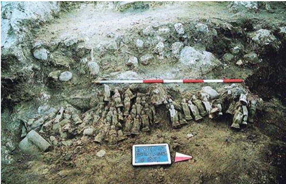
Fig. 1. Le statuette in situ nella US 85