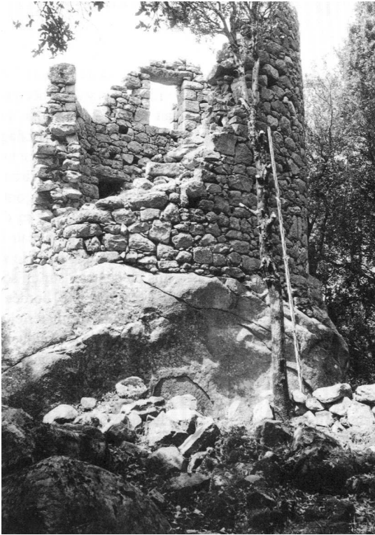
Fig. 1 – PARTIE HAUTE DU VILLAGE MÉDIÉVAL, TOUR SUD