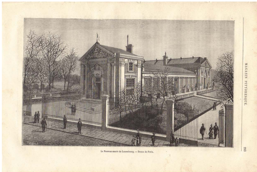
Illustration 1 : Vue cavalière du nouveau Musée du Luxembourg vers le sud-est.