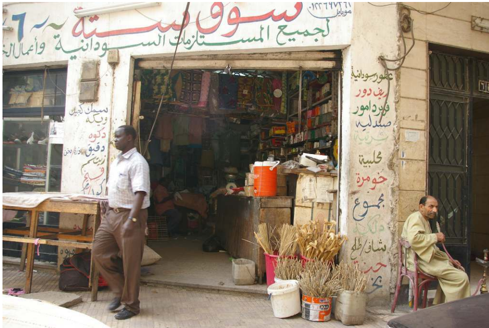
Figure 5. Magasins du Souk seta, Sakakini