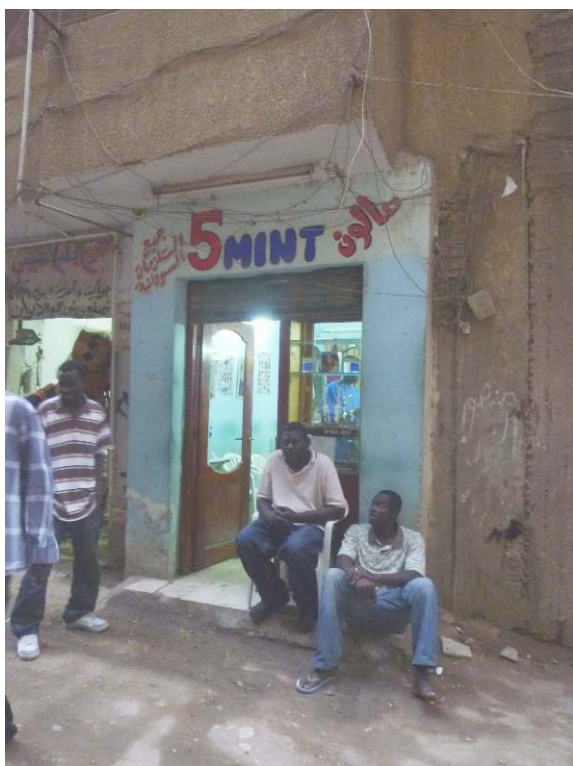
Figure 6. Coiffeur soudanais d'Hadayek el Maadi