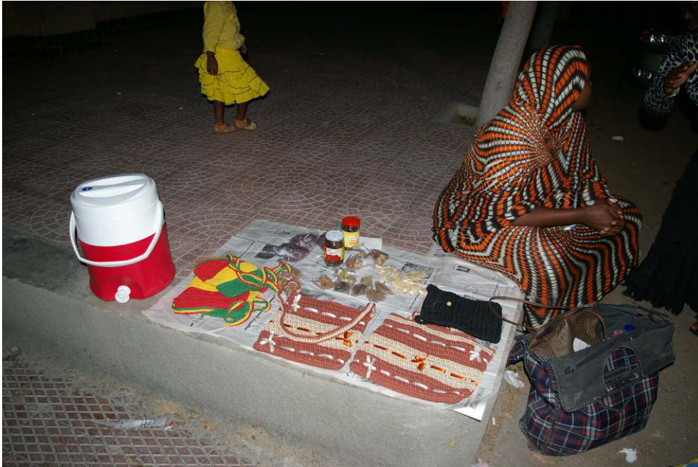
Figure 4. Coiffeur soudanais d'Hadayek el Maadi