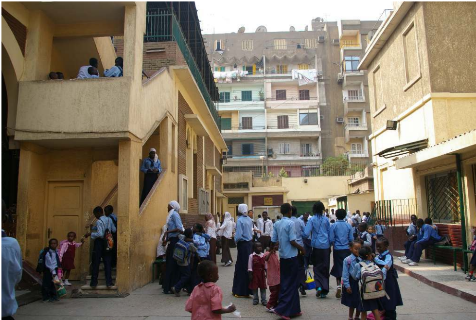
Figure 3. Ecole pour réfugiés, Eglise du Sacré-Cœur de Sakakini