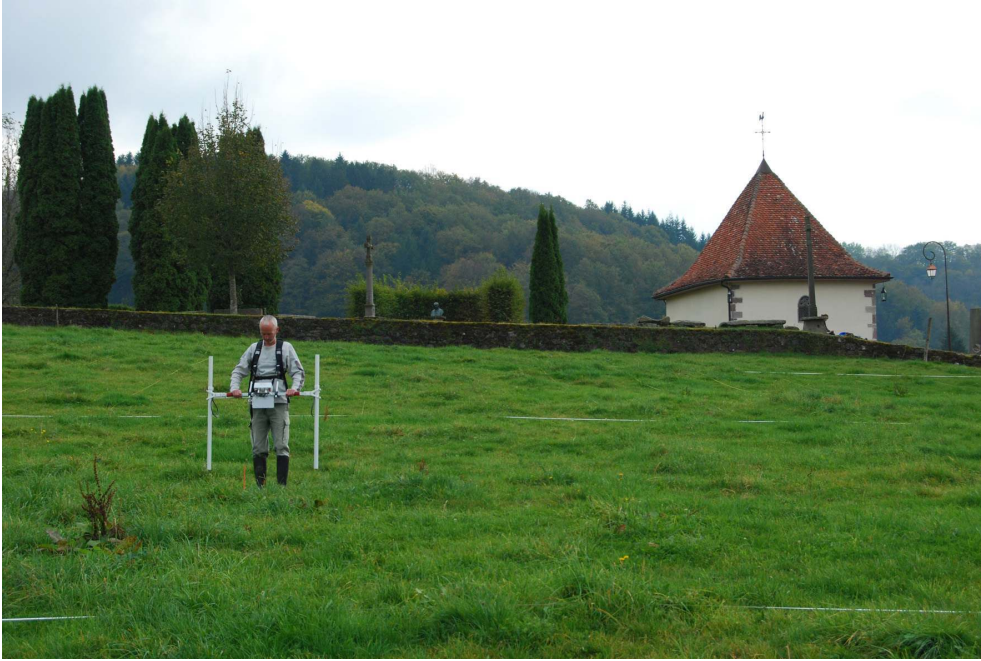
Fig. 2 – Annegray, prospection géophysique sur le flanc nord de la butte.