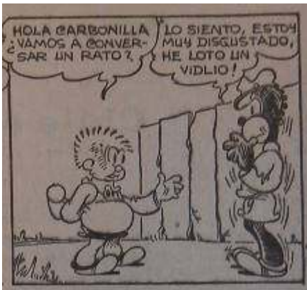
15 Imagen 6