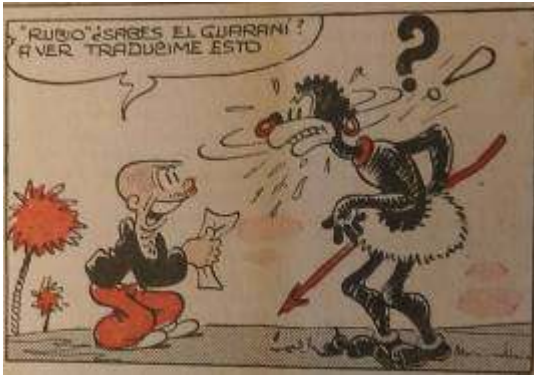
14 Imagen 5