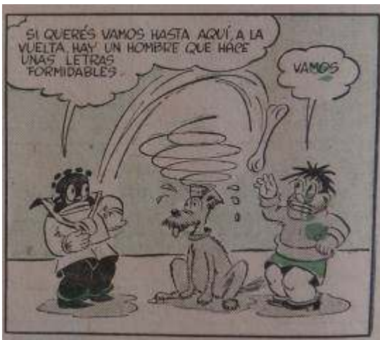
16 Imagen 7