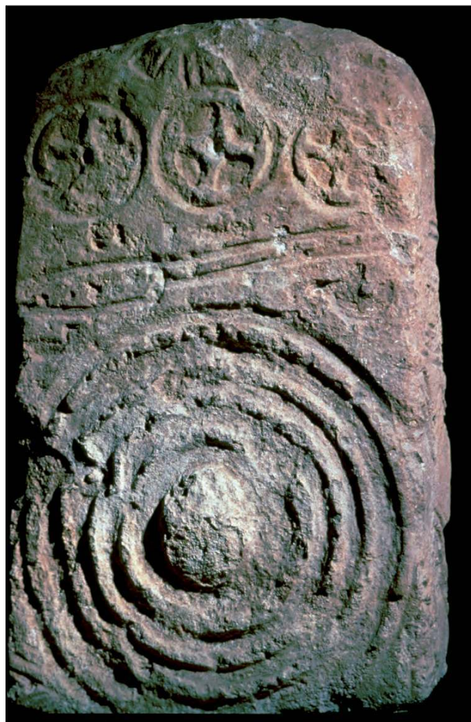
■ 3. Stèle-panoplie de Sextantio (Castelnau-le-Lez, Hérault).

la première provenant de la Ramasse (Clermont-l'Hérault) en Languedoc, la seconde sur le site rhodanien du Pègue (Drôme) et la troisième en Provence orientale, à Robernier-Monfort (Var) (Garcia 2011). Les deux premières, découvertes pour l'une sur un site de la moyenne vallée de l'Hérault en remploi dans le rempart du IV e s. av. J.-C. et l'autre sur le célèbre oppidum de la moyenne vallée du Rhône, également en remploi dans l'enceinte du V e s. av. J.-C., portent un motif de cercles concentriques proche de la représentation d'une cuirasse ou du bouclier de Castelnau-le-Lez. La troisième, découverte anciennement hors contexte, porte au moins trois représentations de ce motif associé à des gravures zoomorphes et géométriques. Sans doute faut-il ajouter à cette petite série un document récemment signalé et provenant de la région des garrigues montpellieraines à Assas dans l'Hérault (Vial 2003, 126-127) et sur lequel on peut deviner une série de cercles concentriques ( kardiophylax ) et une ceinture.