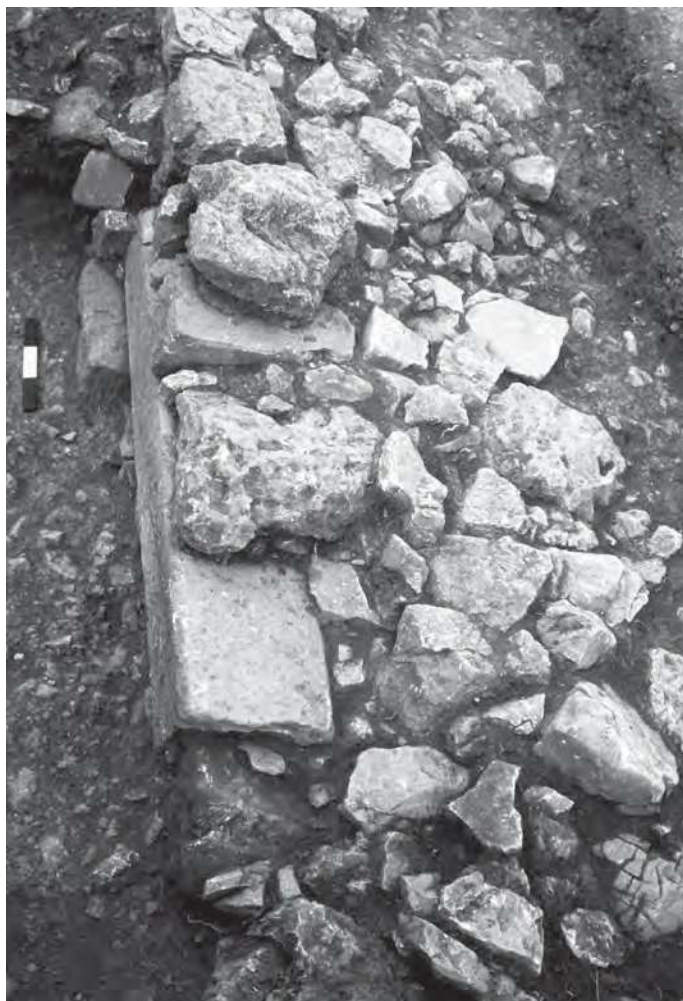
■ 2. Stèles en remploi dans le rempart de l'oppidum de la Ramasse, Clermont-l'Hérault.

que matériellement à sa construction. A minima, comme souvent les ex-votos dans d'autres contextes chrono-culturels, ces monuments, mêmes fragmentés et/ou en réemplois ont, après leur usage initial, conservé une identité culturelle qui fut perçue et respectée lors de leur remploi.