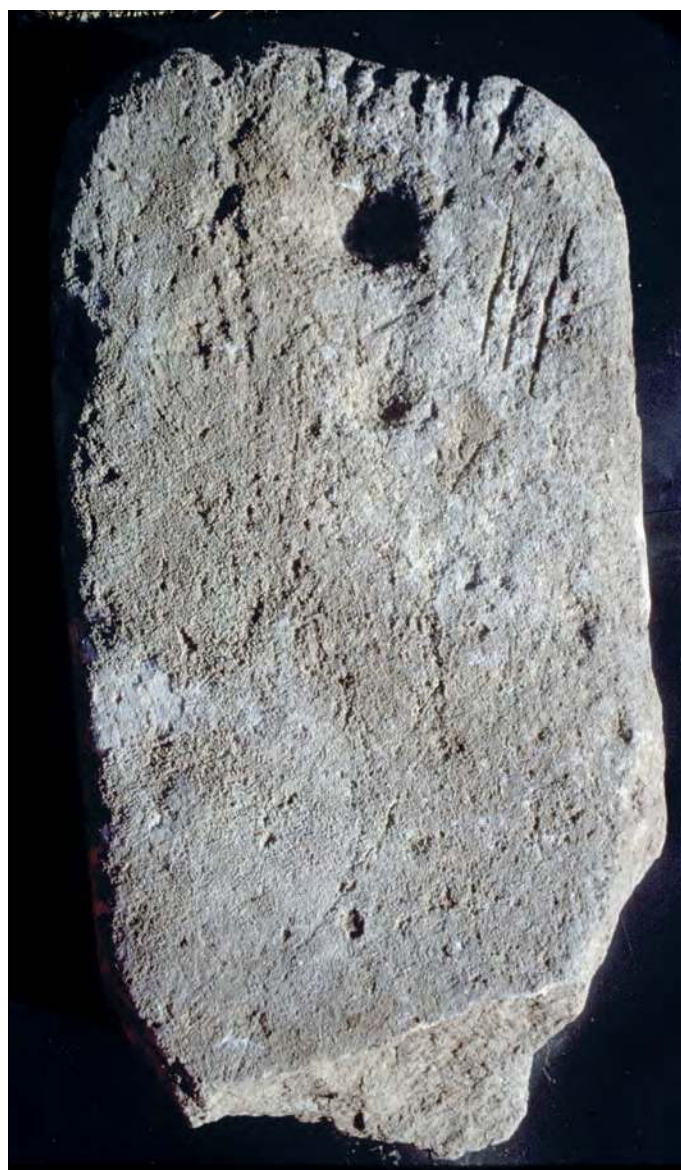
■ 1 Stèle en calcaire à décor de stries et de cupules (inv. 23 ; h. : 0,69) mise au jour dans le tronçon ouest du rempart de l'oppidum de la Ramasse, Clermont-l'Hérault.

Si ces documents attirent l'attention car ils sont les expressions ostentatoires de pratiques religieuses et/ou politiques –voire parfois funéraires–, leur évolution, leur transformation ou leur ruine caractérisent des variations culturelles, économiques et/ou sociales dont la perception s'avère essentielle à l'étude globale des communautés protohistoriques. Au-delà des monuments eux-mêmes, de leur destination primitive et de leur modification, ce sont, à partir de quelques exemples, les modalités et les causes de leur destruction, mais aussi les formes et les raisons de leur réutilisation que nous allons ici tenter de percevoir et d'analyser dans le contexte élargi aux comparaisons offertes dans le cadre de ce colloque. Notre plan tentera de suivre une évolution de l'usage de l'élévation de blocs sculptés au gré de modification sociales et culturelles des populations de la Celtique méditerranéenne, des stèles dressées sur les sanctuaires naturistes au VII e s. av. J.-C. aux statues des aristocrates protégées par des portiques au sein des agglomérations du milieu de l'âge du Fer.