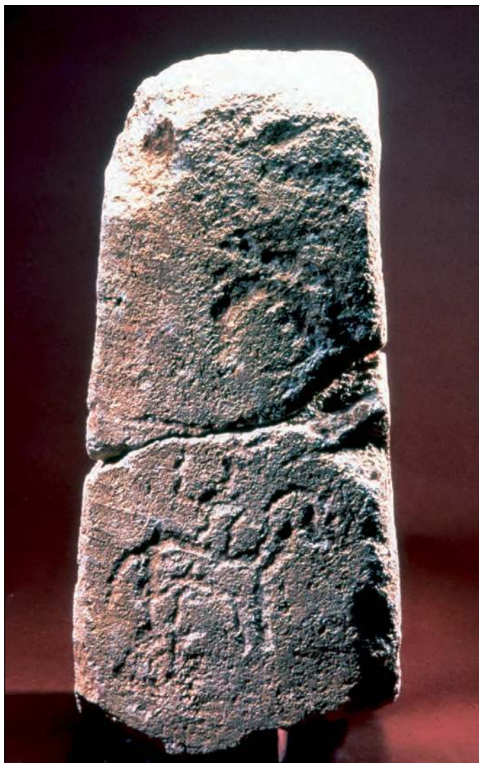
■ 4. Stèle à décor piqueté (décor de guerriers cavaliers de Mouriès.

phase faisant suite aux cultes naturistes exclusifs et montrent par leur réutilisation puis leur réemploi l'évolution et la continuité des pratiques culturelles et des groupes locaux.