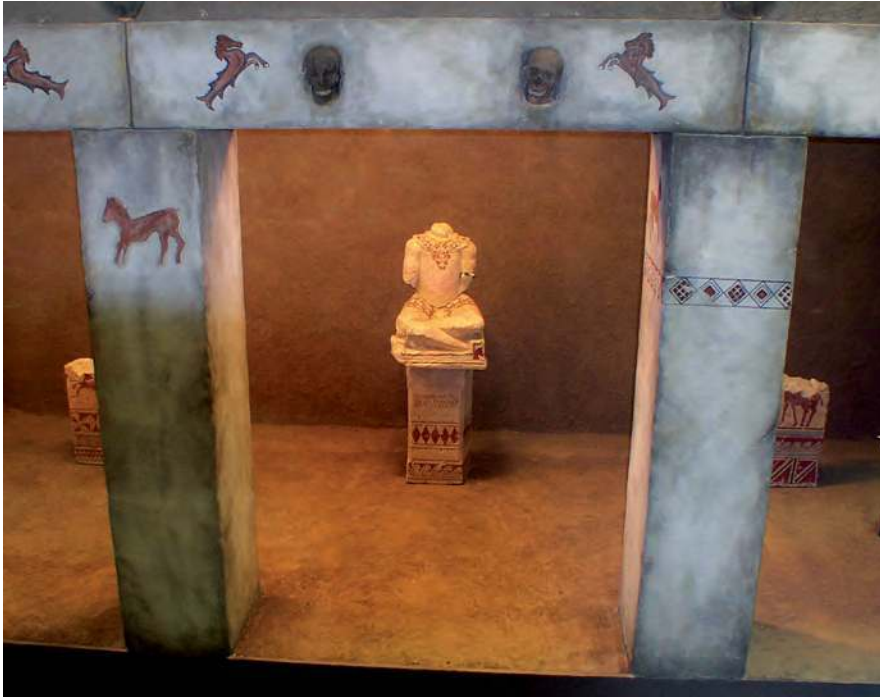
■ 5. Restitution idéalisée d'un portique protohistorique méridional ; Musée de Lyon.

ser des documents disparates tant d'un point de vue chronologique que typologique (fig. 5). On ne rappellera en exemple que les cas de Nîmes - (portique tardo-hellénistique, inscription en gallo-grec de Nertomaros d'Anduze, linteau à alvéoles céphaliques, statue de personnage « accroupi », etc.) (Guillet et al. 1992), d'Entremont (salle hypostyle à étage, fragments de stèles et de piliers décorés, linteau et pilier à représentations de têtes coupées, expositions de crânes, sculptures de personnages « accroupis », etc.) (Arcelin 1992), de Roquepertuse (portique, linteaux et piliers décorés, expositions de crânes, statues de personnages « accroupis », etc.) (Boissinot, Gantès 2000 ; Boissinot 2004) ou de Glanon (portiques et salles hypostyles, linteau et pilier à représentations de têtes coupées, etc.) (Roth 2004).