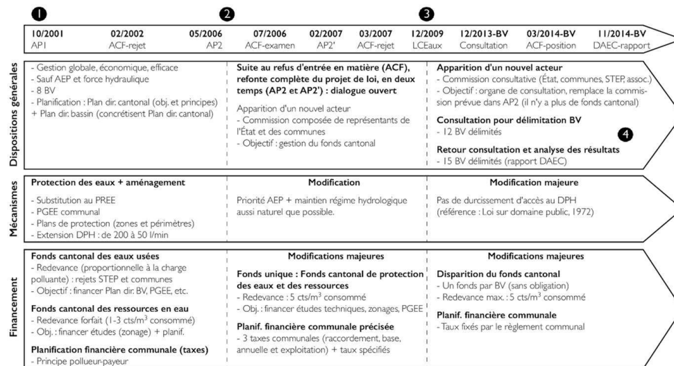
Figure 3. Le renouvellement de la loi sur l'eau à Fribourg : un processus en quatre phases

AP : avant-projet ; AEP : alimentation en eau potable ; BV : bassin-versant ; DPH : domaine public hydraulique ; STEP : station d'épuration ; ACF : Association des communes fribourgeoises ; DAEC : Direction de l'aménagement, de l'environnement et des constructions ; PREE : Plan régional d'évacuation des eaux ; PGEE : Plans généraux d'évacuation des eaux.