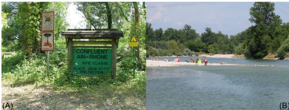
Figure 5. Le confluent à Saint-Maurice-de-Gourdans. (a) L'entrée du site classé, (b) Des baigneurs sur les plages de la rivière d'Ain comprises dans le site classé