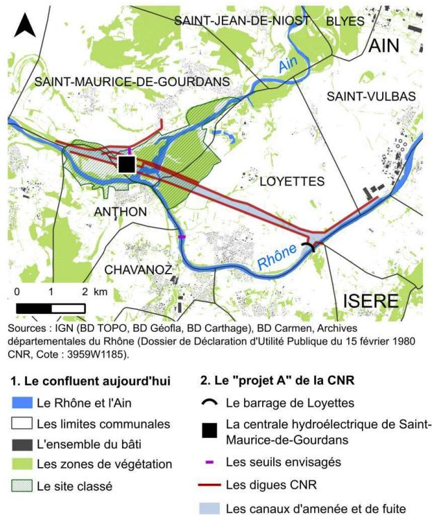
Figure 1. Le confluent Ain-Rhône et le projet de la « Chute de Loyettes »

Sources : IGN (BD TOPO, BD Geofla, BD Carthage), BD Carmen, Archives départementales du Rhône (Dossier de Déclaration d'Utilité Publique du 15 février 1980, CNR, Cote 3959W1185).