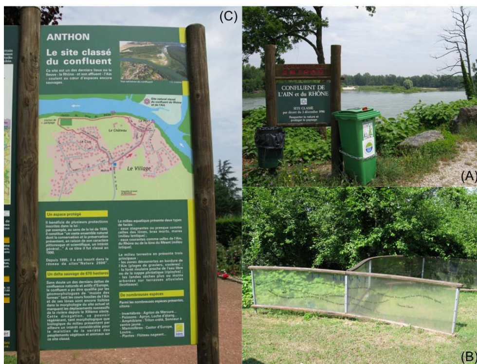
Figure 3. Le confluent à Anthon. (a) La vue sur le confluent depuis « Le Port », (b) Un panneau d'information à l'entrée de la commune, (c) Une installation symbolisant la confluence Ain-Rhône