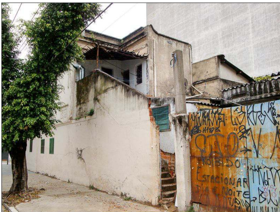
Illustration 5 - Maison abritant un atelier de confection où travaillent et vivent une dizaine d'immigrés Paraguayens, rua dos Italianos, quartier du Bom Retiro à São Paulo