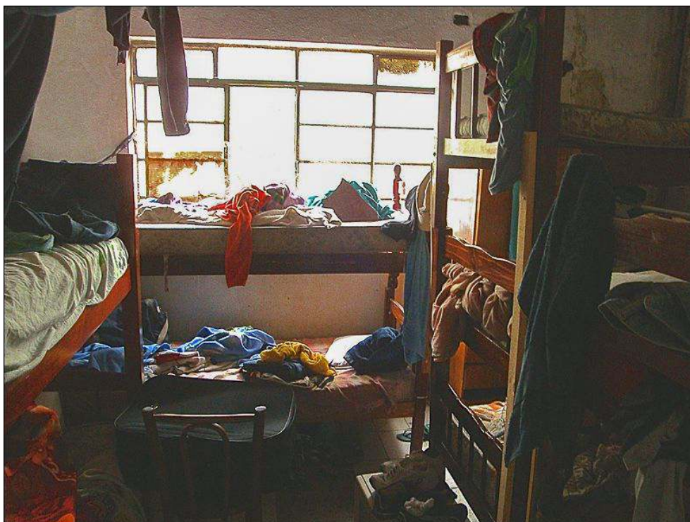
Illustration 7 - Dortoir d'ouvriers, séparé de l'atelier par une cloison, quartier du Bom Retiro, São Paulo