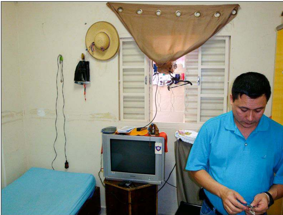
Illustration 6 - Chambre double, dans un appartement collectif hébergeant des ouvriers situé à quelques rues de l'atelier qui les emploie, quartier du Bom Retiro à São Paulo