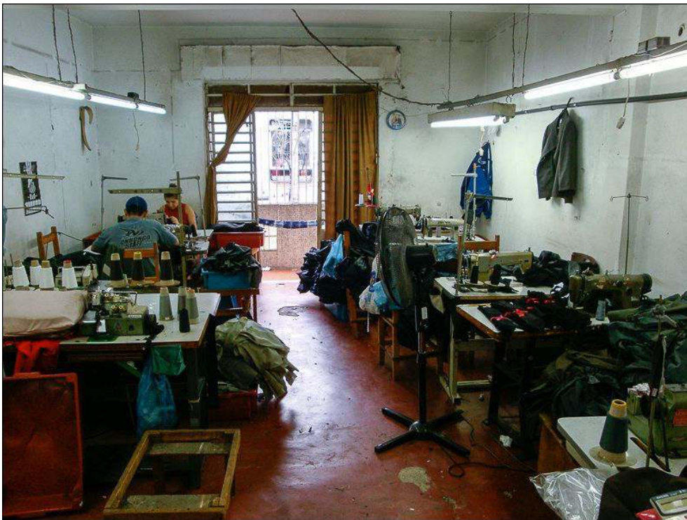
Illustration 1 - Vue générale d'un atelier du centre-ville de São Paulo, Bom Retiro