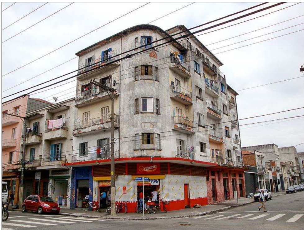
Illustration 4 - Bâtiment résidentiel où sont installés plusieurs ateliers de confection, Rua Hipódromo et Rua 25 de Abril, quartier du Brás, São Paulo