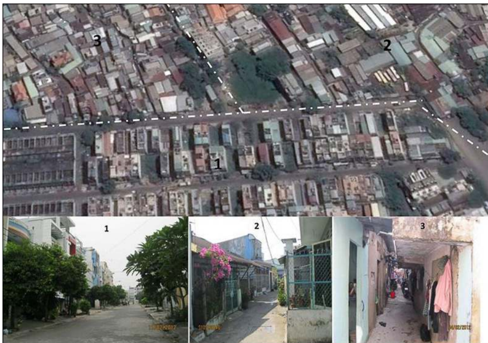
Illustration 2 - Types d'habitat

Types d'habitat : 1 - Aménagé ; 2 – Ancien ; 3 – Précaire.