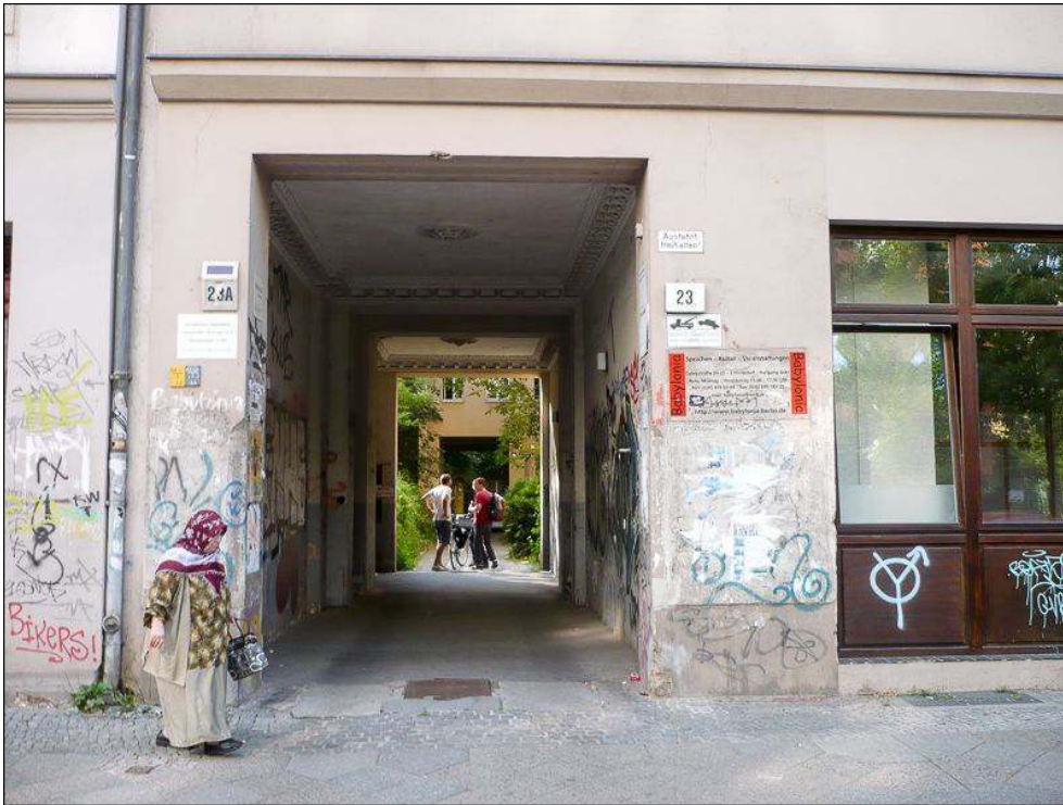
Illustration 2 - L'entrée de Babylonia, vendredi 18 juillet 2014, avant la réunion de Kritische Geographie Berlin