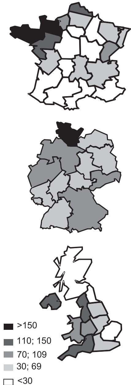
Figure 1. Densité de la production laitière : moyenne 2005-2008 (t/km 2 )

Répartition géographique de la production actuelle