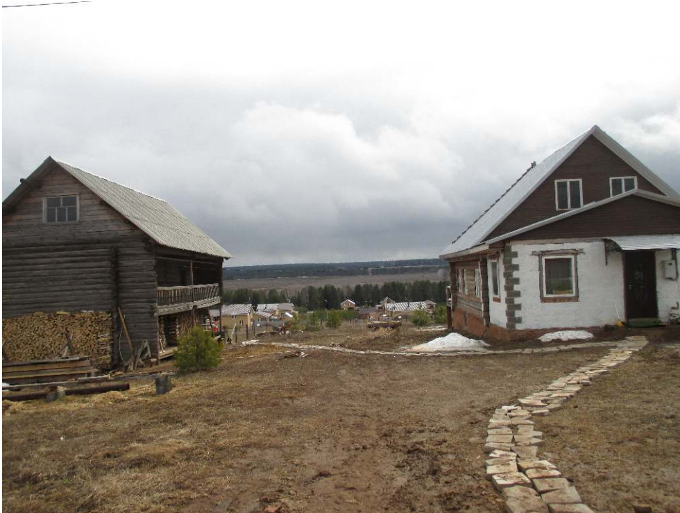
Village d'Izgurt, près de la capitale. À gauche, le kenos traditionnel oudmourte. À droite, la nouvelle maison.