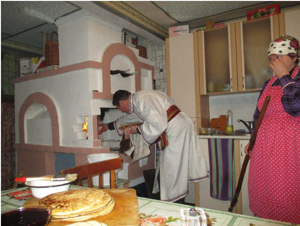
Kuzebaëvo. Le vös'as' jette dans le feu des morceaux de crêpes, après avoir dit une prière. Photo Eva Toulouze, 4/2015.