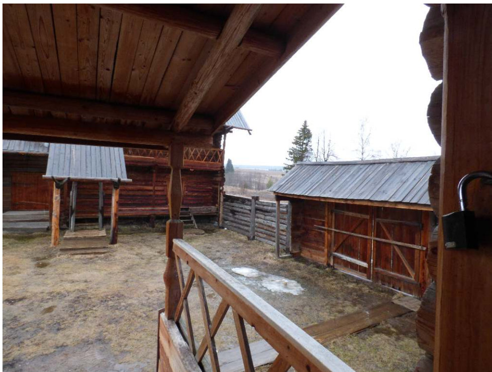
La ferme d'Oudmourtie du Nord au musée en plein air de Ludorvaj. 4/2015.