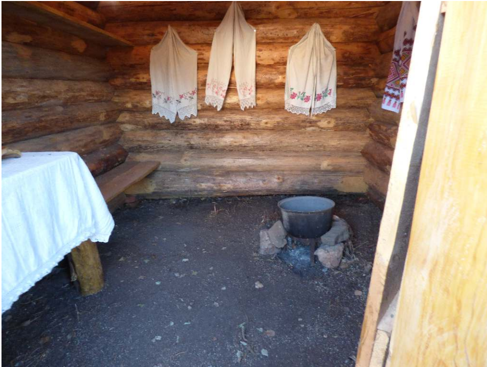
Intérieur de la kuala .