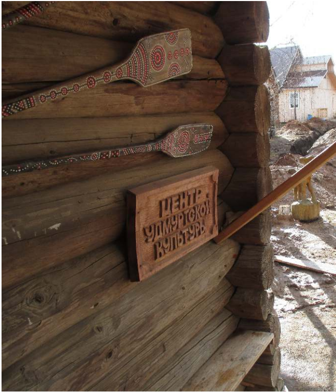
Le Centre de la culture oudmourte ouvert en 2010 à Uddjadi. Photo Eva Toulouze, 4/2015.