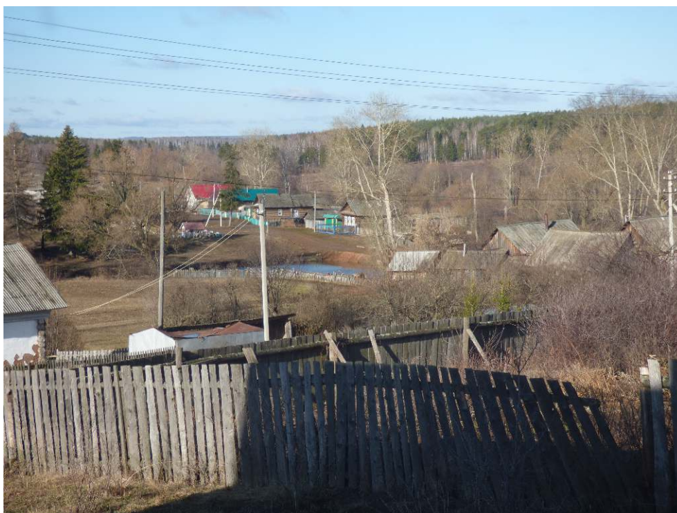
Vue du village d'Uddjadi (Karamas Pel'ga), dans le raïon de Kijaso.