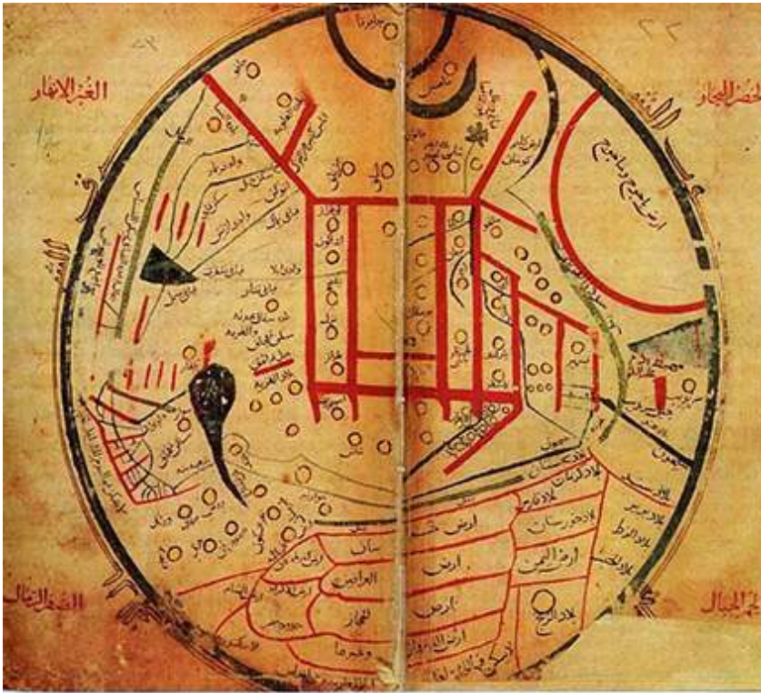
Fig. 3. Le monde turk selon Mahmoud de Kachgar.

ont fini par fonder au cœur du vieux pays arabo-persan le nouvel empire seldjoukide avant de ravir l'Asie mineure aux Byzantins 25 .