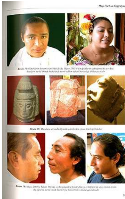
Fig. 5. Couverture et extrait de Doğan, İsmail (2007), Mayalar ve Türklük , Ankara, Ahmet Yesevi Üniversitesi.