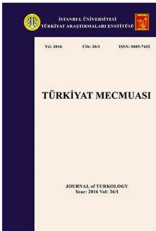
Fig. 6. Couvertures d'exemplaires des revues Yeni Türkiye (2002) et Türkiyat Mecmuası (1925 et 2016).