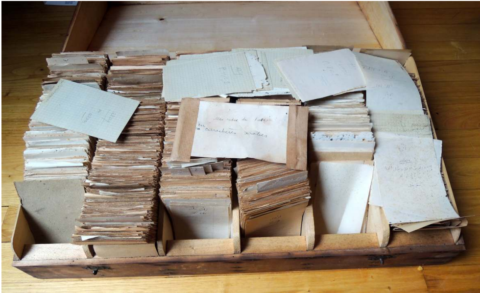
Fig. 4. « Mon index du Kachgarî. En caractères arabes ».