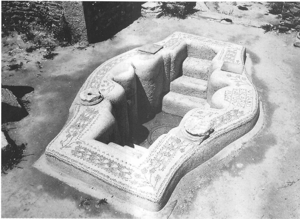
Baptistère de l'église de Vitalis à Sbeitla