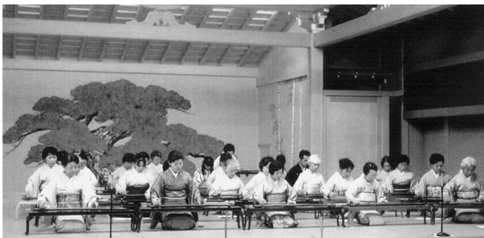
Fig. 3 : Concert à la Seikyodo Ichigenkin, Tokyo