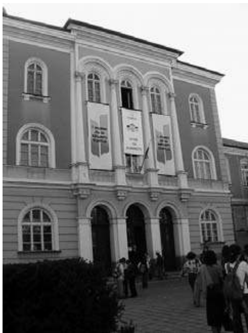
Fig. 2 : École d'Aprilov à Gabrovo, photo 2004