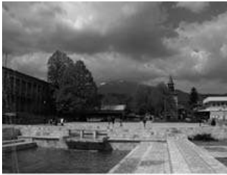
Fig. 1 : Clochers restaurés dans des sites contemporains