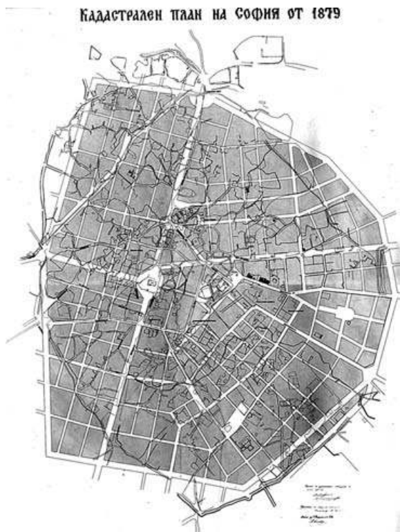
Fig. 3 : Carte de Sofia, 1879 (Mairie de Sofia)