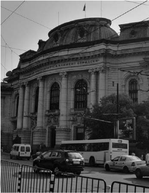
b) Université St. Clément d'Ochrid