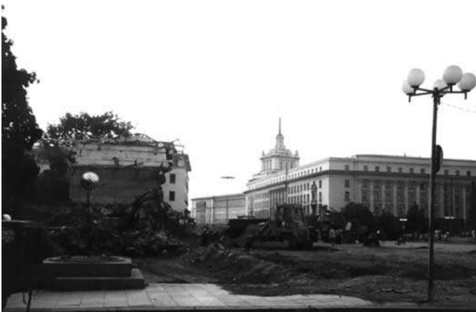
Fig. 8 : Démolition du mausolée de Georges Dimitrov à Sofia, août 1999