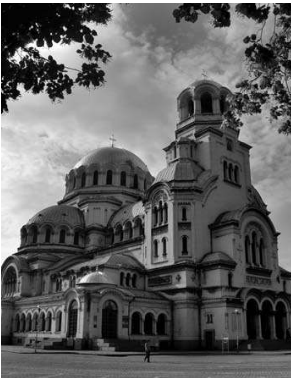
a) Cathédrale Alexandre Nevski construite en 1904-1912