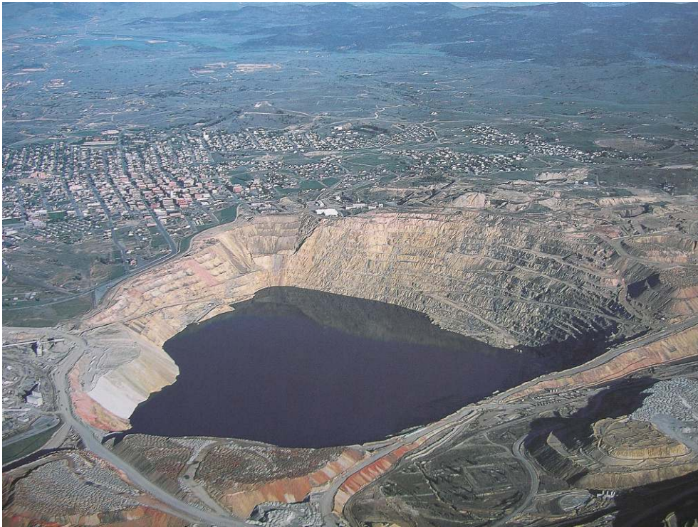
Photo 1 : Le Berkeley Pit à Butte (Montana) où, depuis l'arrêt de l'exploitation en 1982, s'est constitué un lac acide de 300 m de profondeur.