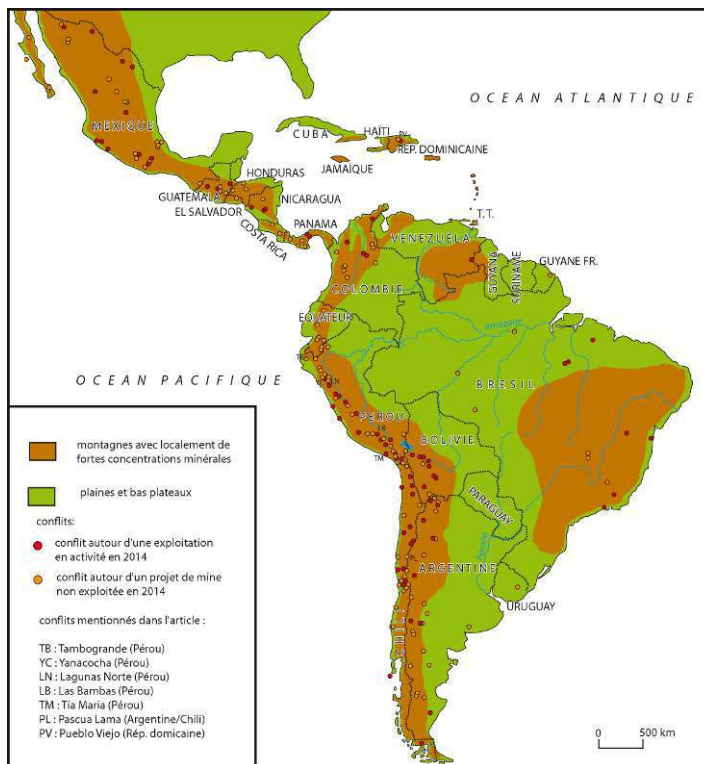
Figure 3 : Les conflits liés à des projets miniers en Amérique latine