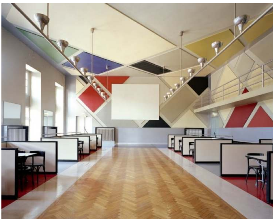
L'Aubette de Stasbourg décorée par van Doesburg, Arp et Taeuber-Arp en 1928