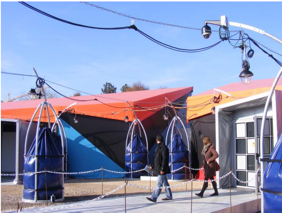
Le Centre Pompidou Mobile, une cabane des Antilles ? Architecture du revêtement