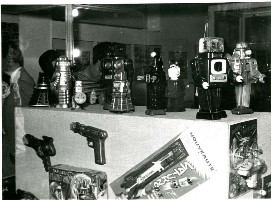
Vue de l'exposition Science-Fiction à la Kunsthalle de Berne