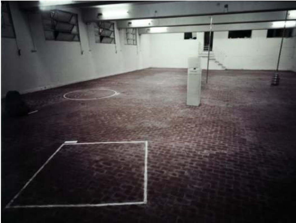
Gino de Dominicis, Installation view, Galleria l'Attico, 1969.