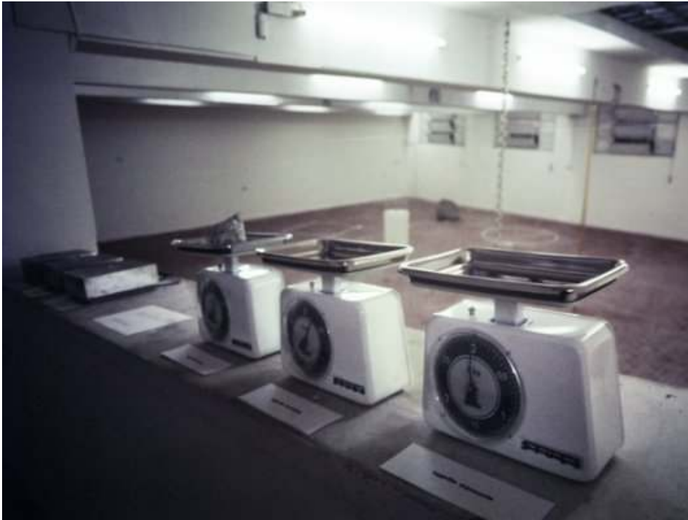
Gino de Dominicis, Installation view, Galerie L'Attico, 1969.

Courtesy Claudio Abate : http://www.galleriailponte.com/index.php?it_abate-per-de-dominicis