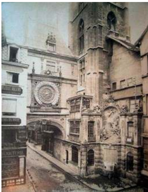
Fig. 1 : Vue du Gros-Horloge après restauration (face ouest) , photographie, Charenton-le-Pont, Médiathèque de l'architecture et du patrimoine, album Durand