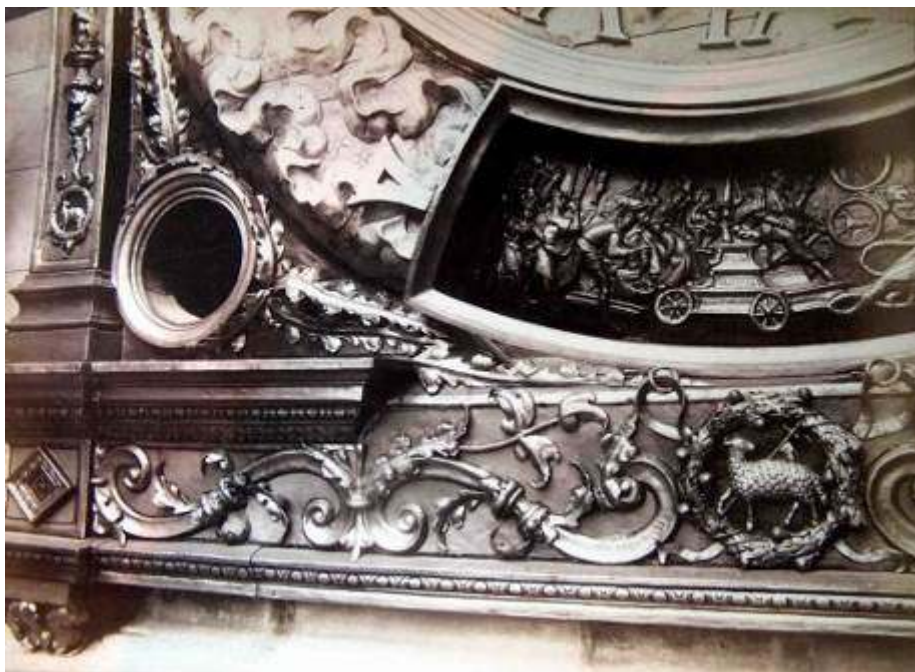
Fig. 4 : Le cadran de l'horloge après restauration (détail de la partie basse), photographie, Charenton-le-Pont, Médiathèque de l'architecture et du patrimoine, album Durand.