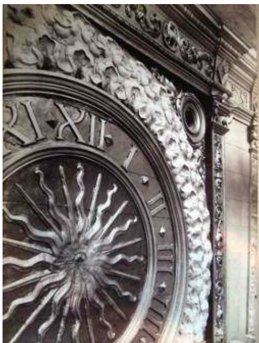
Fig. 3 : Le cadran de l'horloge après restauration (détail), photographie, Charenton-le-Pont, Médiathèque de l'architecture et du patrimoine, album Durand.