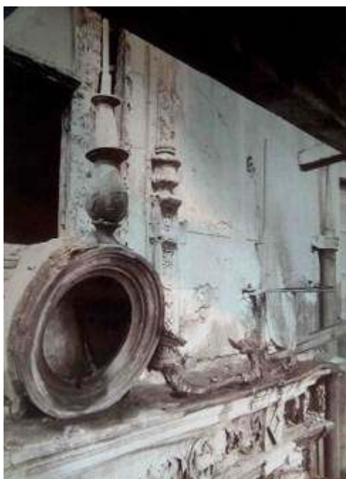
Fig. 5 : Le couronnement du cadran de l'horloge avant restauration, photographie, Charenton-le-Pont, Médiathèque de l'architecture et du patrimoine, album Durand.