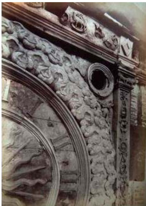
Fig. 2 : Le cadran de l'horloge avant restauration (détail), photographie, Charenton-le-Pont, Médiathèque de l'architecture et du patrimoine, album Durand.