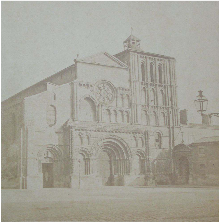
Fig. 1 : Alphonse Terpereau, Église Sainte-Croix avant restauration , vers 1860, tirage sur papier albuminé, 19,9 x 19,8 cm, Bordeaux, archives municipales, 4 | 89.

« Dépenses relatives aux renseignements artistiques commandés par l'architecte et reconnus par lui indispensables. [...] Compte Poirier - photographies de l'état ancien - une vue d'ensemble - deux photographies de détails - en tout trois clichés 240 F 7 . »