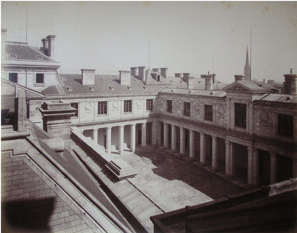
Fig. 5 : Alphonse Terpereau, Faculté de médecine pendant travaux , vers 1886, tirage sur papier albuminé, 36,9 x 48,2 cm, Bordeaux, archives municipales, 5 M 52.

Toutes ces images, qu'elles représentent le chantier ou reproduisent les modèles, témoignent plus de la multiplication des contrôles et du travail à distance qu'elles ne répondent à un réel besoin.