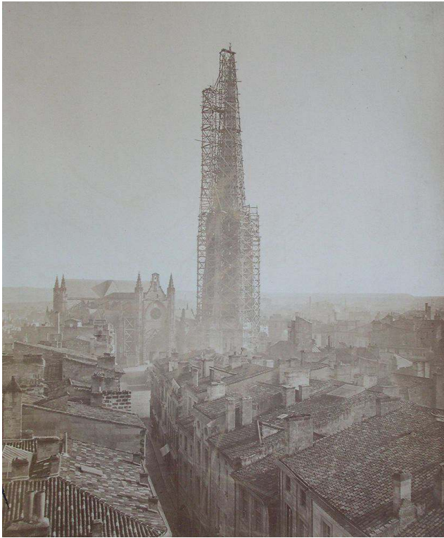
Fig. 4 : Alphonse Terpereau, Échafaudage de la tour Saint-Michel , 1865, tirage sur papier albuminé, 46,6 x 37,9 cm, Bordeaux, bibliothèque municipale, XVI 51-4.

Parallèlement à cette production réduite, les ingénieurs de la ville vont faire de l'échafaudage de la tour le symbole du savoir-faire des services municipaux qui est, cette fois-ci, largement diffusé. Ainsi, en 1865, Louis Lancelin, le directeur du Service des travaux publics de Bordeaux commande à Terpereau une photographie de la tour avant le démontage des échafaudages (fig. 4) 37 . Une lettre indique que l'ingénieur a lui-même choisi le cadrage et le point de vue. Ce qu'il obtient correspond à ce qu'il désire : une vue de la partie haute de la flèche recouverte de l'échafaudage se détachant sur un ciel vide. Coupé du contexte urbain, l'échafaudage apparaît ici comme une icône représentant la volonté et la puissance du conseil municipal.