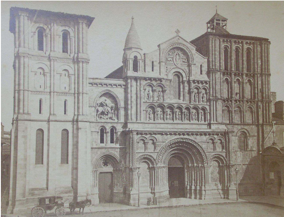
Fig. 2 : Alphonse Terpereau, Église Sainte-Croix après restauration , vers 1865, tirage sur papier albuminé, 21,8 x 28,9 cm, Bordeaux, archives municipales, 4 I 10.

Une vue de l'édifice après restauration est réalisée par le photographe Alphonse Terpereau (fig. 2). Destinée au grand public, elle se retrouve aux archives municipales 19 et dans le dépôt légal du photographe à la Bibliothèque Nationale 20 . Cette photographie est collée sur bristol et encadrée d'une zone plus foncée imitant la cuvette de la gravure sur cuivre dont elle reprend les conventions pour la signature (« Terpereau Phot. » signifiant photographe) 21 . Rangée dans un portefeuille ou encadrée sur un mur, elle devient peu à peu un objet de décoration qui participe aux stratégies d'ameublement des intérieurs bourgeois 22 .