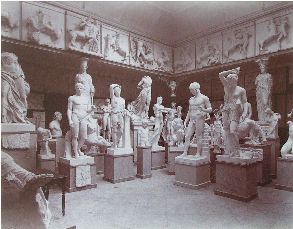
Fig. 6 : Alphonse Terpereau, Musée archéologique de la faculté des sciences , vers 1886, tirage sur papier albuminé, 19,9 x 26,1 cm, Bordeaux, bibliothèque municipale, H 87.

En ce qui concerne la faculté des sciences, Durand fait lui aussi appel à Terpereau. Le photographe livre le même type d'image concernant le chantier auquel s'ajoutent des vues de l'édifice achevé, ce qui suppose un usage différent. Tout d'abord, les photographies du chantier sont moins nombreuses. Les archives municipales conservent ainsi cinq vues du chantier et une vue des modèles sculptés. L'architecte et les artisans étant localisés à Bordeaux, la production de ces images n'est plus justifiée. Contrairement à la faculté de médecine, une seule photographie du chantier est datée 55 . Les autres perdent leur valeur documentaire pour ne garder que l'aspect théâtral de la série.