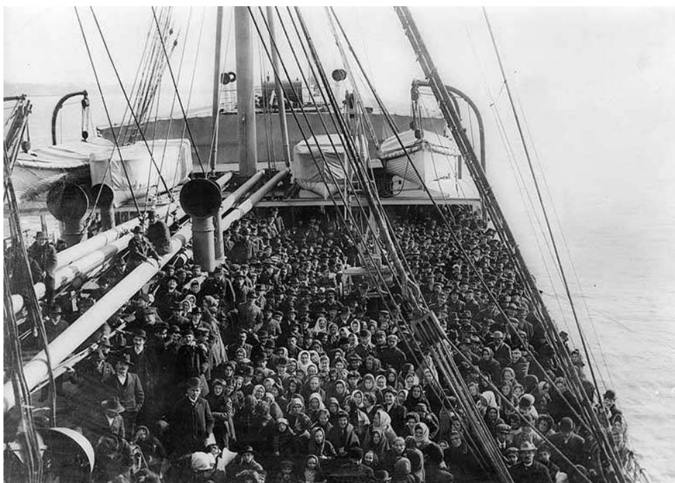
Émigrants sur un bateau transatlantique.