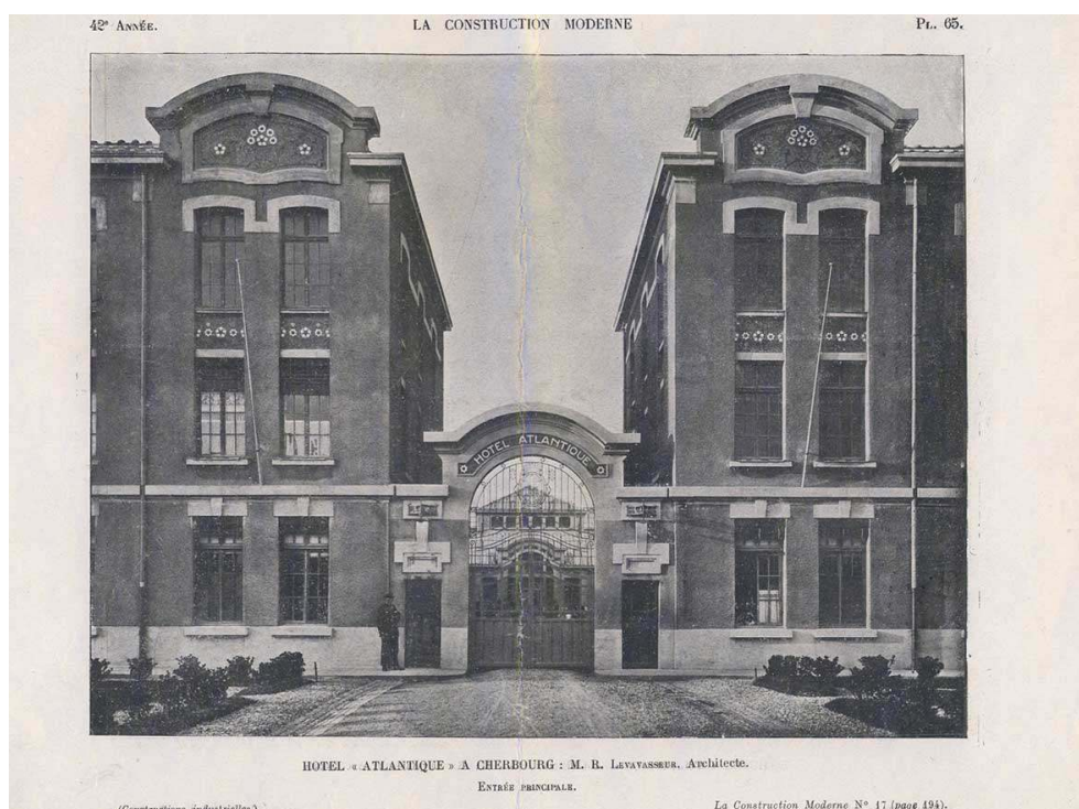
Hôtel Atlantique de Cherbourg. Dans PLANAT, Paul. « L'hôtel Atlantique ». La Construction moderne [Texte imprimé] ; n° 17, 23 janvier 1927, p. 194.