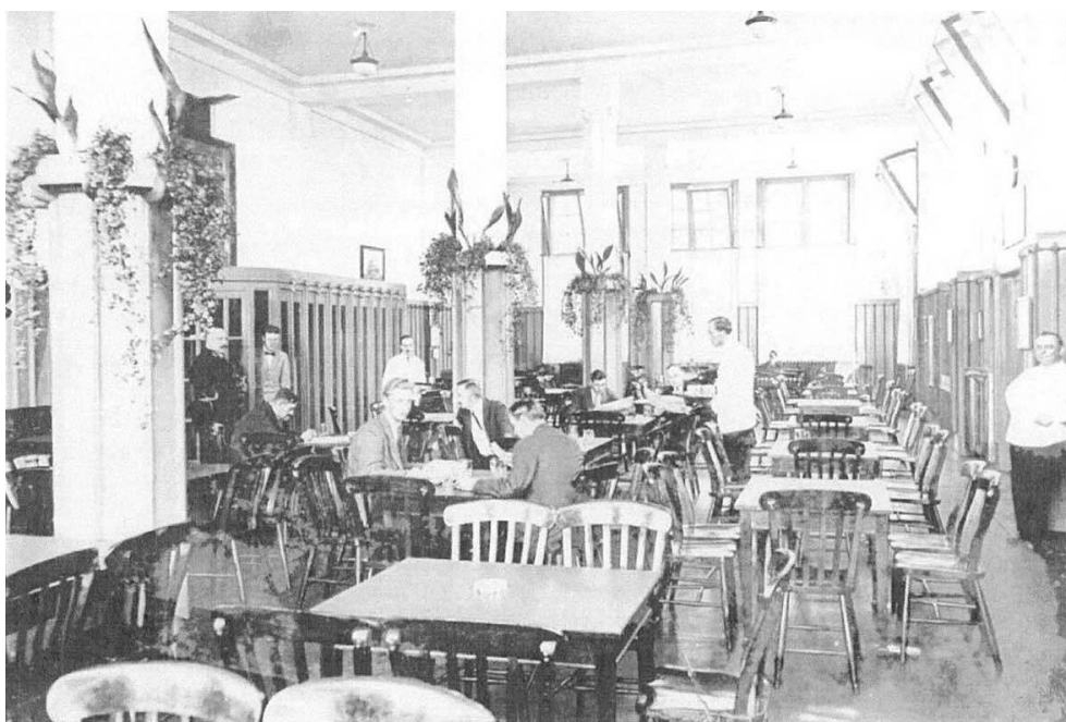
Salle de conversation du Lloyd Hotel d'Amsterdam.