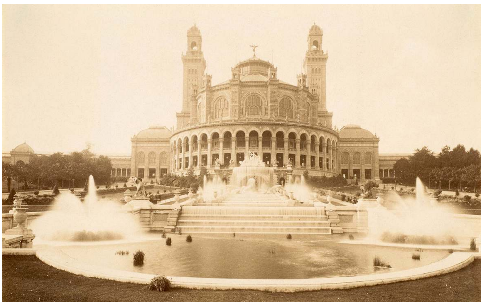
Palais du Trocadéro. Phot. anonyme, c. 1890.

© METROPOLITAN MUSEUM OF ART, © WIKIMEDIA COMMONS, 2015.