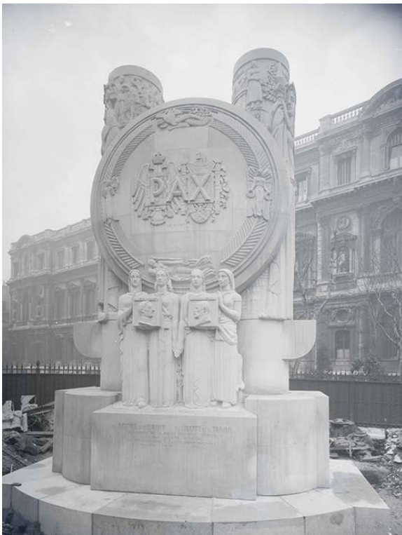
Anonyme, Monument à la paix, photographie sur plaque de verre, 1938, inv. 89.3.4008.7.2