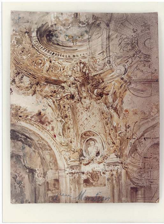
Gaston Castel, Angle de voussure d'un arc , encre et lavis sur papier, 1910, série 1989.3, coll. musée d'Histoire de Marseille.