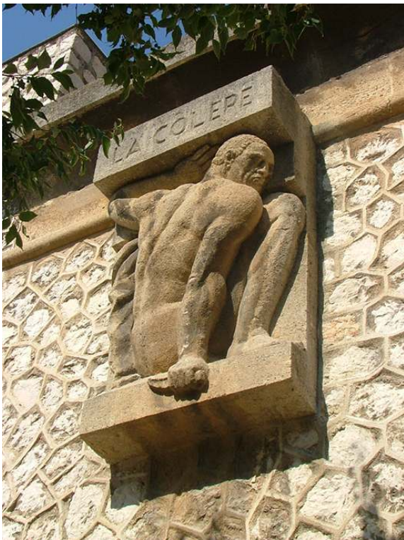
Antoine Sartorio, La Colère , bas-relief en pierre, 1938, enceinte de la prison des Baumettes, Marseille.