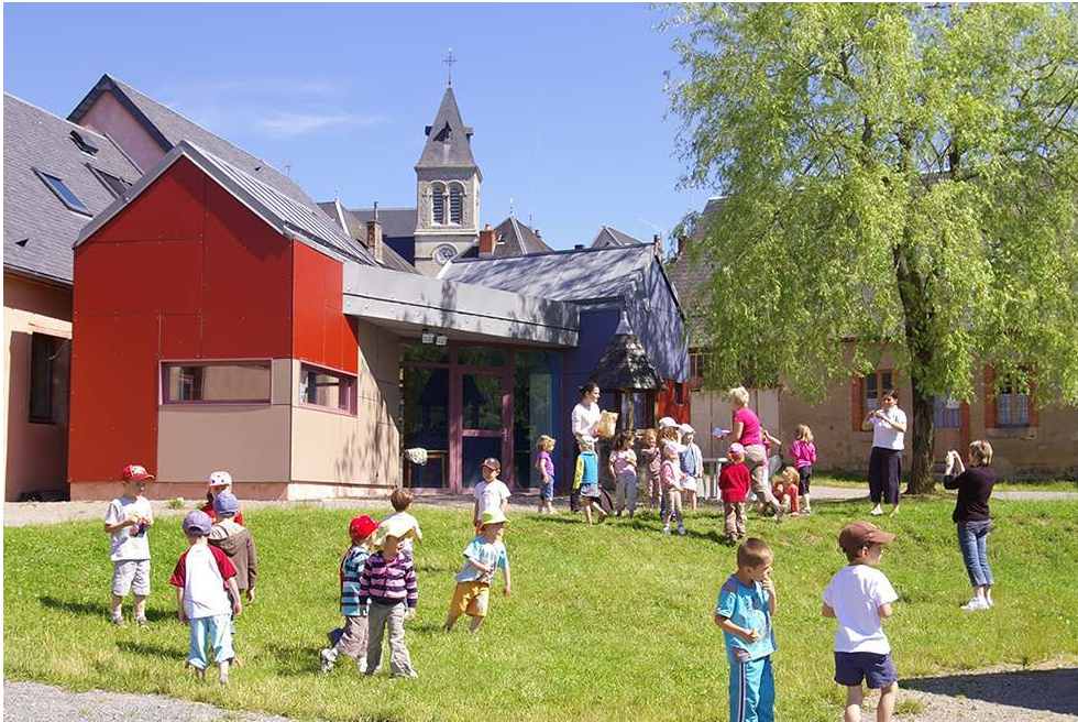
Maison du Patrimoine Oral de Bourgogne, vue depuis le jardin lors d'une animation scolaire. Phot. Valérie Edern, 2009. Collection et repro. MPO, 2009. © MPOB.