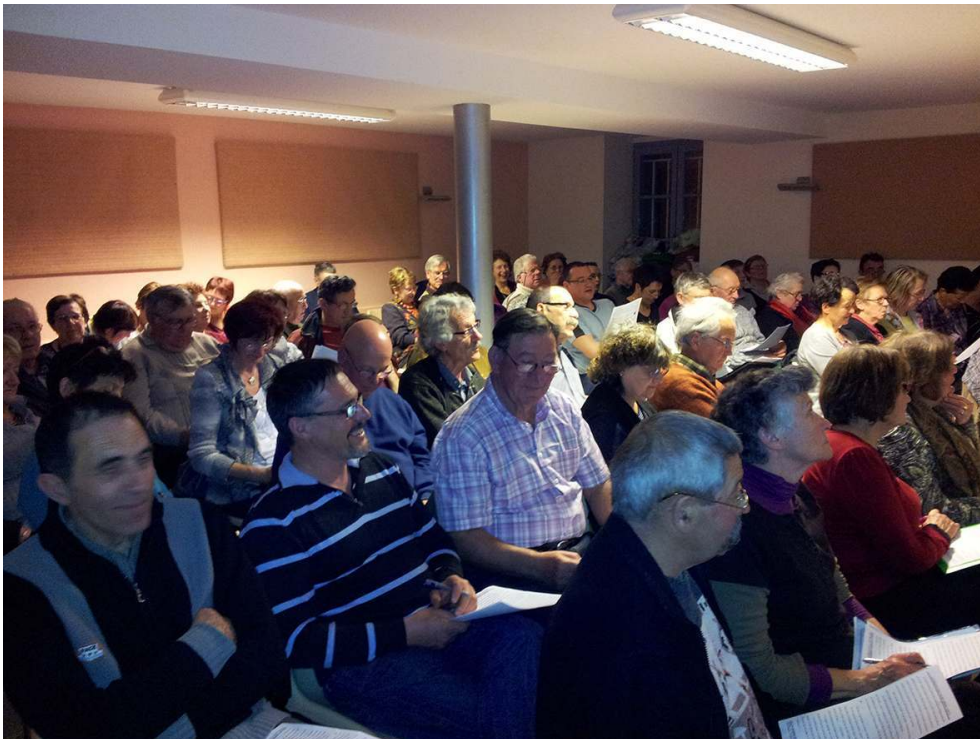
Atelier « Les Raibâcheres du Bochet ».

Phot. Jean-Luc Debard, mars 2015. Collection et repro. Langues de Bourgogne, 2015. © Langues de Bourgogne.