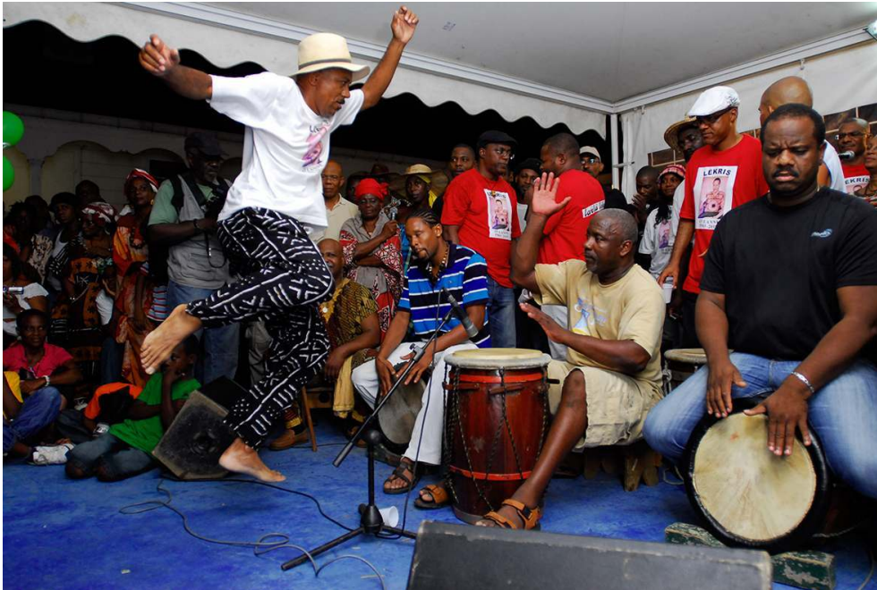
Le Gwoka. Face à face dansè-makè (danseur-tambourier).