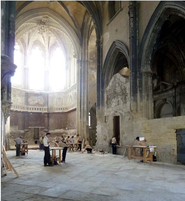
Le compagnonnage, réseau de transmission des savoirs et des identités par le métier.