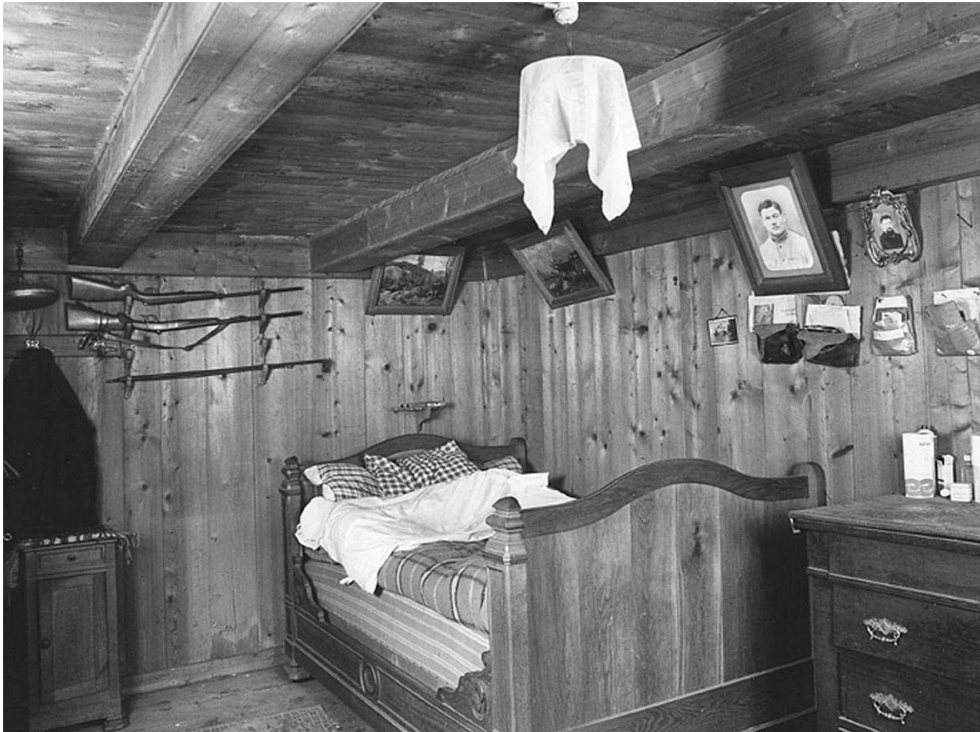
Grand'Combe-Châteleu (Doubs). Chambre de la ferme de Cornabey