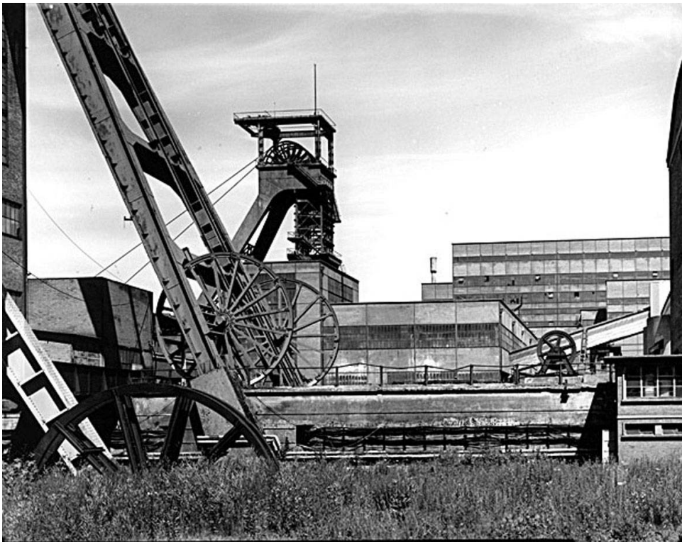
Petite-Rosselle (Moselle). Chevalement de mine