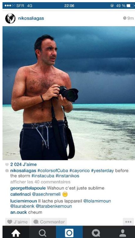
Fig. 1. Le photographe se met en scène : l'exposition de soi