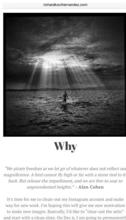
Fig. 2. La fermeture d'un profil : une symbolique forte