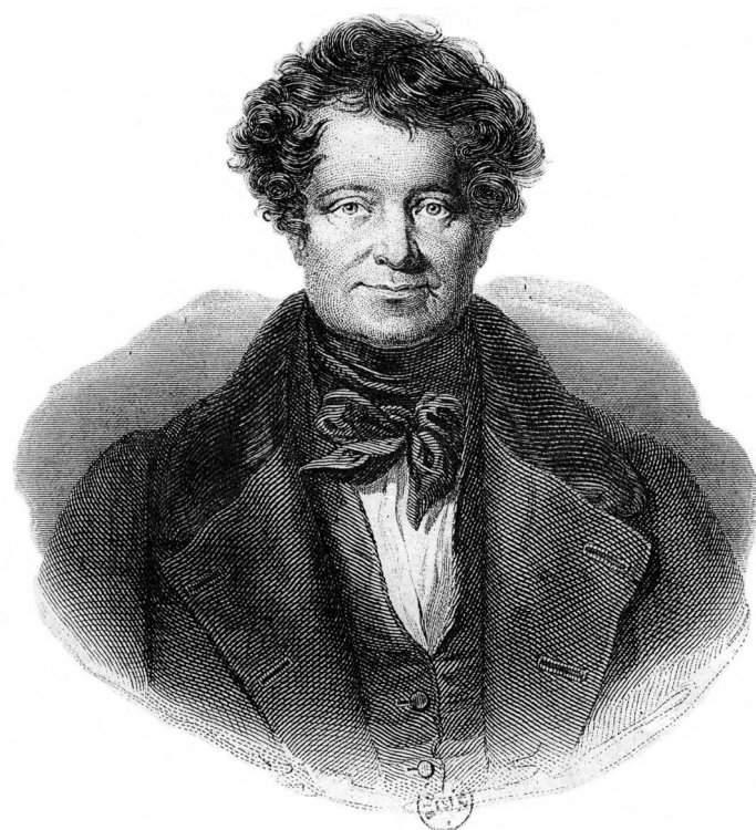
Figure 3 : « Daniel O'Connell »