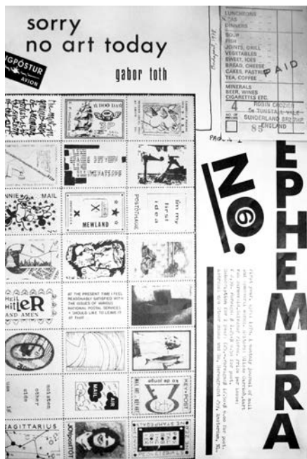
À droite Couverture de la revue Ephemera , n° 6, Amsterdam, Ulises Carrion (éditeur), avril 1978.