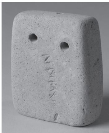
Fig. 3. — Pesa de telar del Cabezo de la Guardia, Alcorisa (Teruel). S. II - I a.C. Museo de Teruel.

marcas, nombres o incluso pequeñas frases 83 . Podrían identificar la producción de un taller cerámico determinado, el nombre de la propietaria/o, algún tipo de circunstancia de la pieza, etc. En la fig. 3 puede verse un ejemplar procedente de Cabezo de la Guardia, Alcorisa (Teruel). Para Joan Ferrer, a quien agradecemos esta información, la lectura es clara menos en los últimos signos NIS TA++. En un ejemplar de Castro de Lerma (Burgos) 84 puede leerse el nombre Iuliae , que al estar en genitivo indica a la propietaria de la pesa. El hecho de que la inscripción sea anterior a la cocción no es óbice para ello. Los objetos por encargo pudieron hacerse y cocerse ya con el nombre solicitado por la persona que los encargara. La presencia de improntas sobre pondera realizadas con sellos personales también estaría en esta línea. A veces, incluso encontramos marcas hechas con los dedos. Un peso de telar hallado en Nieva, Benagéber (Valencia), lleva grafito con nomen y cognomen masculino 85 . Probablemente en este caso se trata del fabricante de la pieza; pero pudiera tratarse de un textor , o de un dueño de algún taller, donde sin duda podrían trabajar mujeres también.