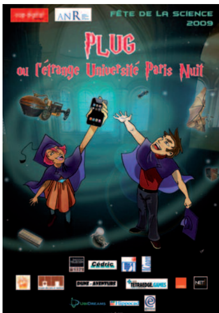
Un des deux jeux déployés dans le cadre du projet PLUG.