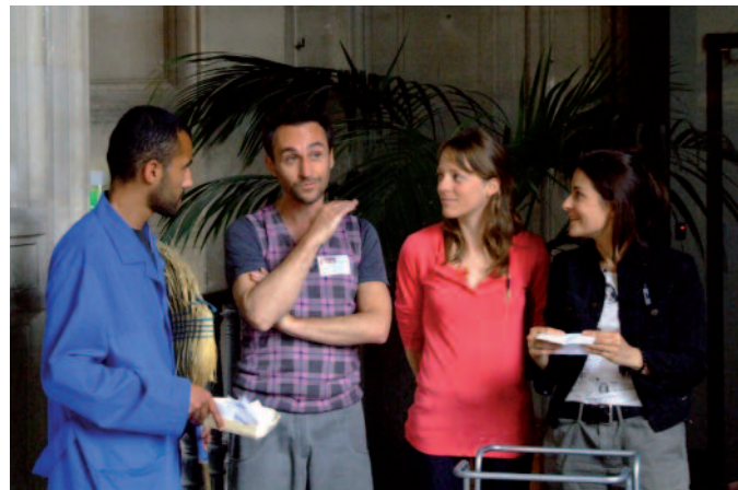
La restitution des connaissances acquises par les joueurs lors de la grande scène finale.

Lors de la scène finale, les joueurs font face à la Grande Z, M. Picard et la Directrice de l'UPN. Cette dernière leur raconte la genèse et les objectifs de cette université parallèle : former les meilleurs étudiants qui soient pour en faire des inventeurs de génie dont l'inspiration se nourrirait des inventions passées. Chaque équipe est appelée à la barre d'un tribunal pour répondre à l'ultime énigme : restituer leur parcours de jeu en résumant le lien entre l'objet contemporain (l'objet cible) et l'un des objets ancêtres (objets intermédiaires). Chacun doit enfin argumenter son désir d'intégrer l'UPN. La directrice est seule juge d'admettre ou non les différents candidats à l'université, après avoir pris conseils et avis auprès de la Grande Z. Avant que tout le monde ne se sépare, la Directrice fait prêter serment à tous les joueurs de ne jamais dévoiler le secret de l'UPN et d'utiliser la