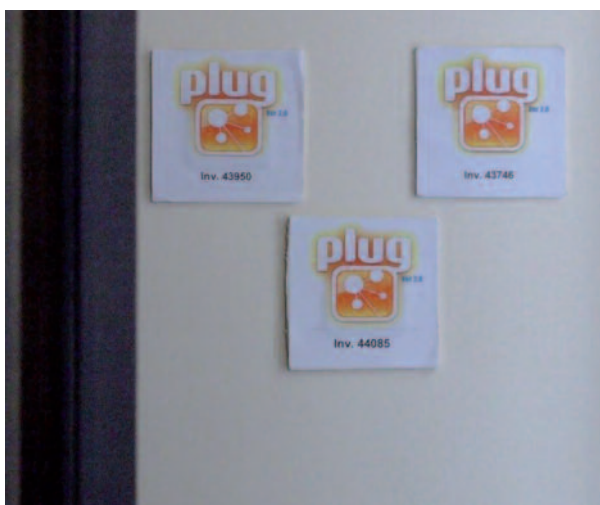
Chaque objet était identifié par son numéro d'inventaire sur les tags RFID.

Des rencontres impromptues entre équipes ont été imaginées pour consolider le lien social entre les visiteurs-joueurs. Créer des occasions de rencontres maintient une équipe dans le rythme du jeu et évite le risque d'un jeu trop monotone. Par exemple, lorsqu'une équipe était en retard, le Maître du Jeu la convoquait ainsi qu'une autre pour qu'elles s'affrontent dans le cadre d'une joute. Chaque membre de chaque équipe mimait un objet du musée sans que les autres participants, y compris ceux de son équipe, le connaissent. L'équipe ayant reconnu le plus d'objets gagnait la partie et le droit de pirater le cartable