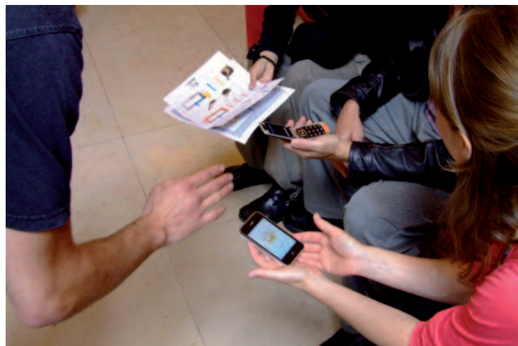
Les joueurs en pleine chasse au trésor