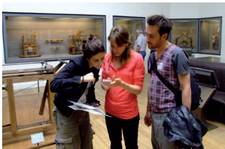
Les joueurs de PUPN sur le terrain

Par ailleurs, d'un point de vue comportemental et sociologique, il a été instructif de noter l'attitude des joueurs face au commissaire de police lors de la dernière scène du jeu : ont-ils ou non dévoilé le secret de l'UPN au commissaire ? Dans la majorité des cas,