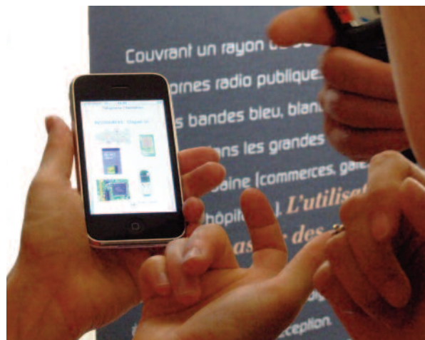
Une riche documentation est disponible dans le smartphone et au centre de documentation du musée.

Pour chaque « objet intermédiaire », une question technique, scientifique ou historique était posée en lien avec l'« objet cible ». Pour développer un apprentissage actif, notre objectif était que le joueur n'ait pas simplement à choisir des solutions préparées mais qu'il dispose de documentation lui permettant de répondre à toute question posée sur un objet. De la riche documentation multimédia était disponible dans le terminal mis à la disposition des joueurs (un iPhone) ou au centre de documentation du musée.