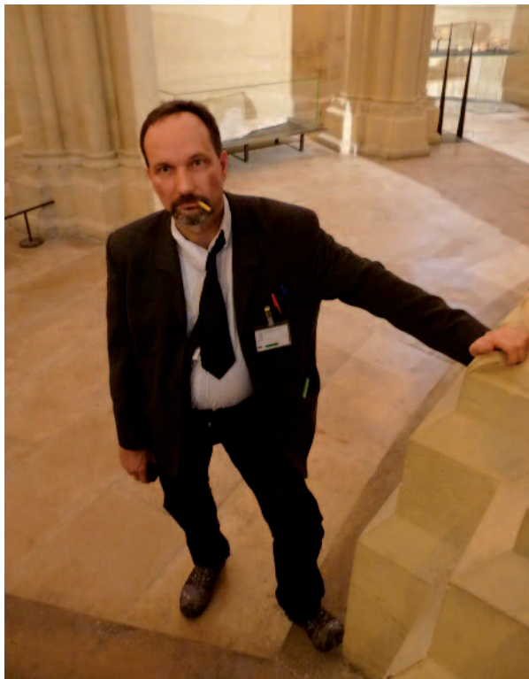
L'univers de PUPN : des comédiens dans des lieux insolites

multiples épreuves à passer pour cela, avec notamment une épreuve finale d'envergure face à la Directrice. Puis la Grande Z, présidente de l'incontournable Bureau des Élèves, les accueille de façon bienveillante tout en leur remettant l'ensemble des équipements dont ils auront besoin pour passer les épreuves, et qui composent le « cartable électronique ». Elle leur explique également la joute, une tradition officieuse et spécifique à l'université.