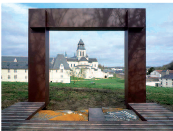
L'abbaye de Fontevraud avec, au premier plan, la maquette du dispositif Robert d'Arbrissel