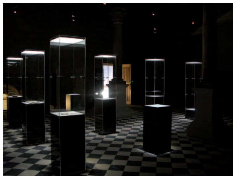
La salle du Trésor

La trame et la circulation d'un espace à l'autre est le fil rouge qui emboîte le pas du visiteur. La salle du Trésor, point de convergences et de rencontres, invite les visiteurs à entrer dans un espace plongé dans la pénombre, silencieux. Sur le sol au quadrillage noir et blanc, quelques objets « soclés » s'imposent aux visiteurs. Une mise en scène épurée, un éclairage minimaliste conçu par le scénographe Éric