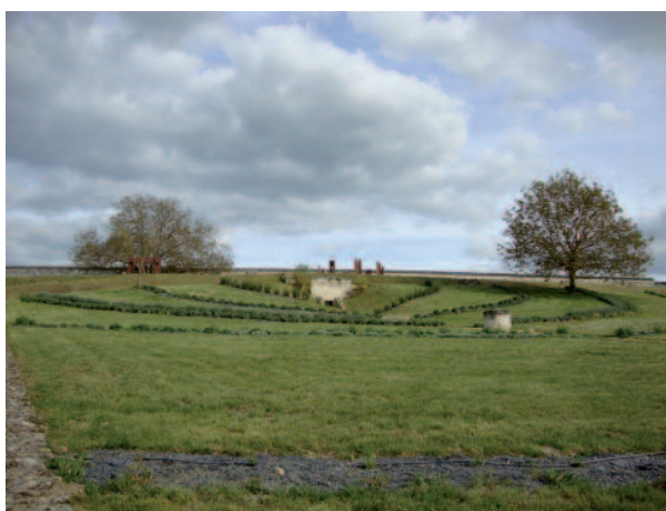
Vue générale du dispositif Robert d'Arbrissel © Éric Verrier

Pour réponse, nous nous sommes installés dans le champ de l'expérimentation. Très vite, il a alors fallu déterminer les lieux d'installation, proposer une trame simple pouvant faire référence pour chaque module, définir le niveau de restitution en phase avec le lieu. Il y avait nécessité à coller, d'une part, à l'immédiateté de la demande et d'autre part au respect dû à l'histoire dans sa complexité et la durée. D'emblée le caractère éclaté du dispositif s'impose à nous, dans le temps et dans les espaces. C'est le postulat de départ sans être une contrainte. Le parti pris muséographique se construit alors à partir de notre propre expérience du lieu. S'ensuit un long travail d'étude et d'immersion dans l'espace. Nos pas se mêlent avec ceux des visiteurs. Puis nous explorons de nouveaux cheminements. Nous prenons le temps d'observer les visiteurs dans leurs postures, leurs stations, leurs rythmes. Notre connaissance du lieu commence à s'affiner. Composer avec les vides, subvenir à l'absence d'archives et interroger les grands espaces architecturaux nous obligent à regarder autrement le lieu. Les cheminements de visite nous