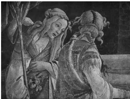
2. Sandro Botticelli, Les Épreuves de Moïse , détail avec Zéphora, 1481-1482, Vatican, Chapelle Sixtine.