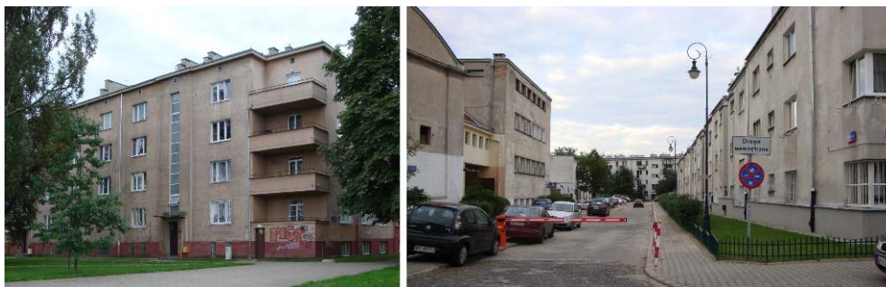
Figure 3 : Immeubles construits durant la période socialiste à Żoliborz