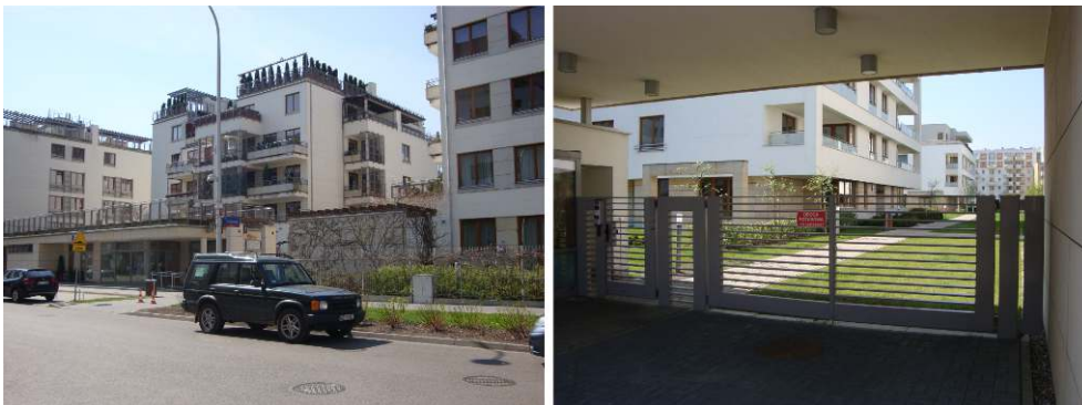
Figure 7 : Résidence fermée Marina à Mokotów