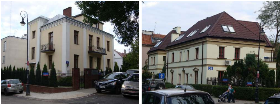
Figure 4 : Maisons individuelles d'avant-guerre rénovées à Żoliborz

ont énormément construit dans ce quartier dans les vingt premières années de l'époque socialiste. Cette place de choix leur permet d'avoir accès à toutes les infrastructures (surtout publiques) et, ne disposant pas de voiture, leurs déplacements sont facilités par les transports en commun très développés dans ces anciens quartiers. Ces quartiers ont également l'avantage d'accueillir des élites plus récentes ayant assez de capital économique pour rénover d'anciens bâtiments d'avant-guerre (Fig. 4). Les quartiers périphériques et la banlieue couperaient les anciennes élites de leurs vies sociales (ou mondaines), notamment à cause du coût du déplacement, car ces liens restent fragiles notamment parce qu'ils ne sont plus actifs professionnellement.