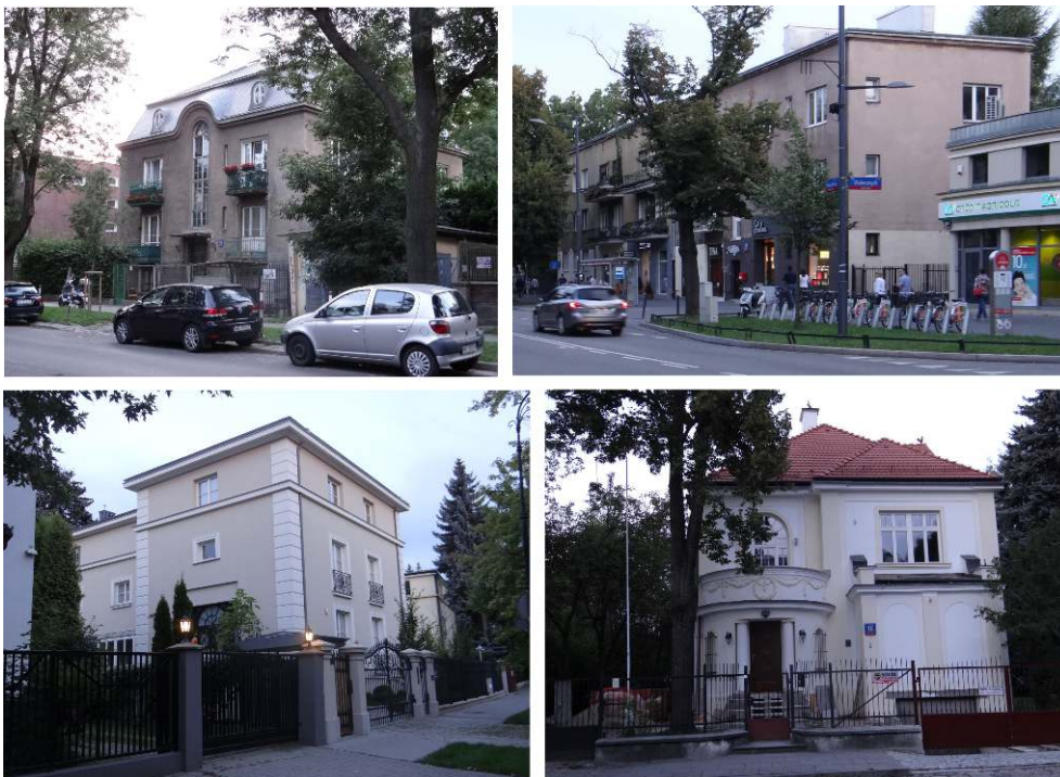
Figure 5 : Habitats caractéristiques à Saska Kępa