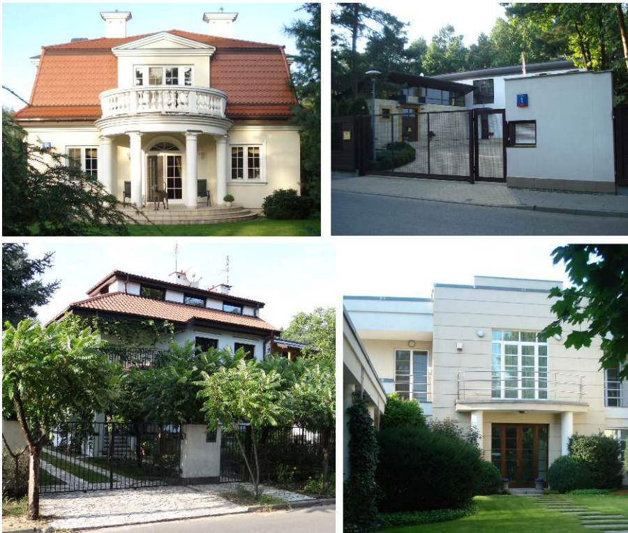
Figure 6 : Exemple de maisons individuelles à Wawer (Anin)