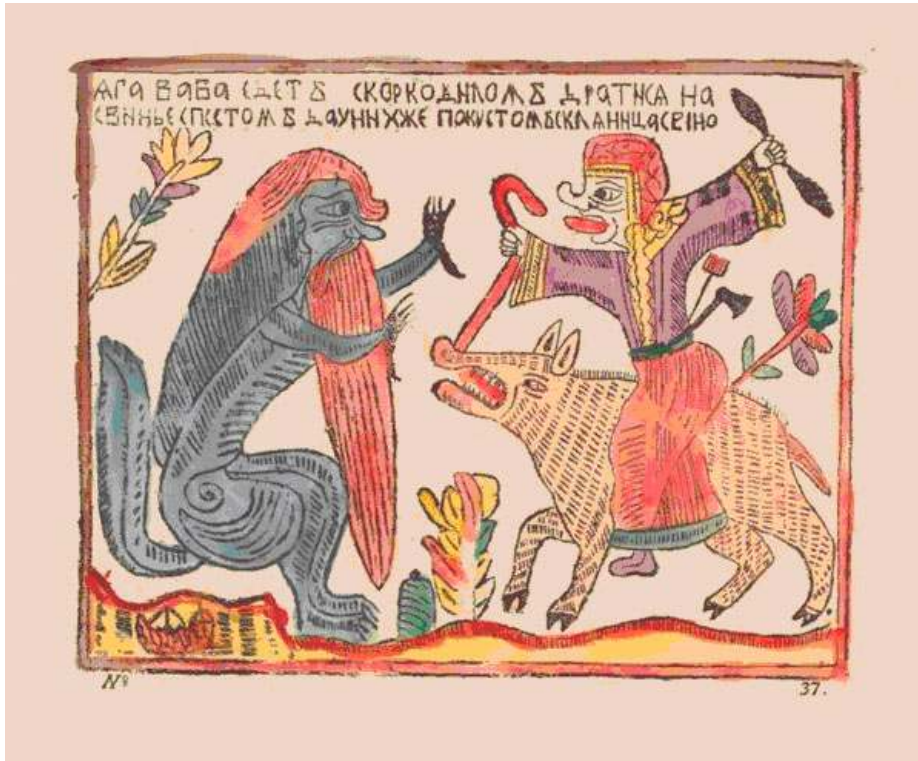
Image 1 – Yaga-Baba part combattre le crocodile à dos de cochon avec un pilon. Ils ont une fiole de vin sous le buisson (1760 environ).