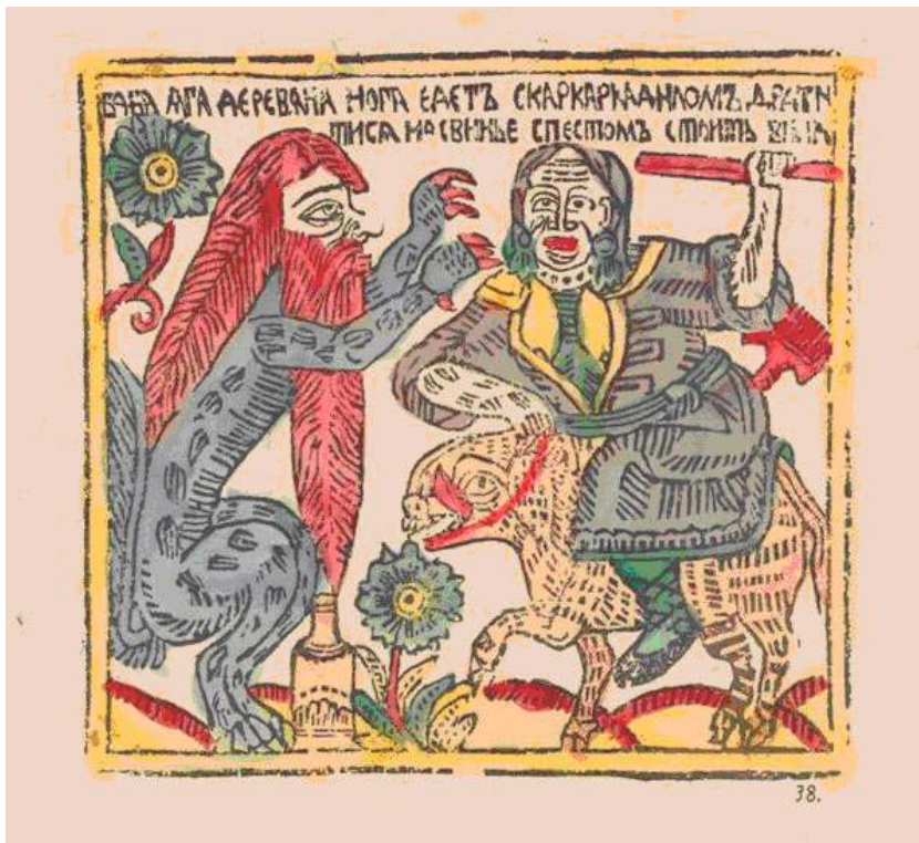
Image 2 – Baba Yaga jambe de bois part combattre à dos de cochon le karkadil avec son pilon. Il y a du vin (1760 environ).