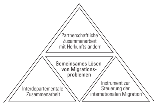
Abbildung 2: Merkmale von Migrationspartnerschaften

Quelle: T. Liechti, Migrationspartnerschaften: ein neuer Ansatz der schweizerischen Migrationspolitik? , Fribourg, Lizentiatsarbeit, Departement Sozialarbeit und Sozialpolitik, Universität Fribourg, 2007, S. 97.