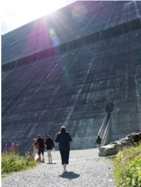
Illustration 6. L'entrée des galeries du barrage de la Grande Dixence