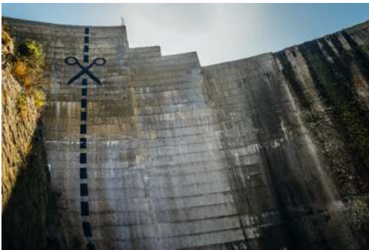
Illustration 7. Graffiti prodémantèlement sur le barrage de Matilija (Californie)