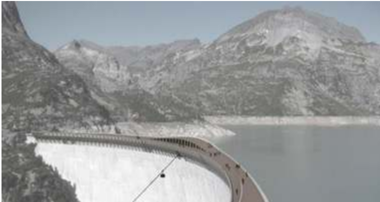
Illustration 8. Une maquette d'hôtel sur le couronnement du barrage d'Émosson