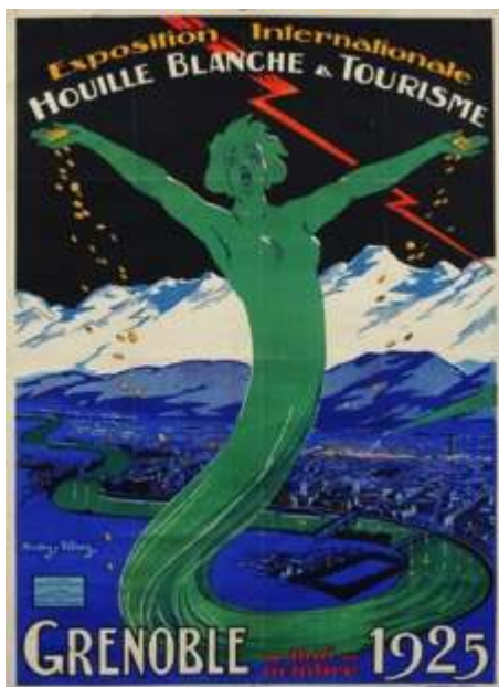
© Andry-Farcy, 1925 (coll. Musée dauphinois).