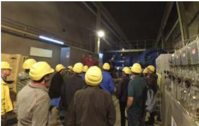
Illustration 5. Visite du complexe de Bieudron-Grande Dixence

manière sensible lorsqu'on fait l'expérience du vide depuis le pied ou au sommet du barrage, lorsqu'on se baisse pour passer sous de gigantesques conduites forcées dont on imagine les débits d'eau extrêmes qui les traversent dans un bruit sourd, lorsqu'on touche du bout des doigts l'empreinte laissée par la pression de l'eau sur les pales des massives turbines en acier, etc. (ill. 6). Si tout cela paraît pour le moins spectaculaire et dépaysant pour le visiteur profane, l'aspect routinier de la visite dédramatise la situation. En parcourant les murs d'une structure en activité, le visiteur découvre le quotidien des employés qui y travaillent. Les guides sont eux-mêmes « familiers » de la structure : il s'agit le plus souvent d'ingénieurs à la retraite ou d'étudiants dont l'un des membres de la famille y travaille. Lorsqu'ils se croisent, guides et ouvriers se saluent, s'échangent des regards complices ou des remarques amicales. Lors de la visite de l'usine hydroélectrique de Bieudron, située en aval et couplée à la Grande Dixence, nous sommes invités à porter un casque de sécurité aux couleurs de l'entreprise. La guide prête également des pulls estampillés Alpiq aux estivants trop légèrement vêtus pour les températures glaciales des galeries du barrage (6 °C). Là encore, le fait de vêtir temporairement le « costume » du travailleur a un effet performatif en invitant les visiteurs à une certaine empathie envers l'entreprise et ses collaborateurs.