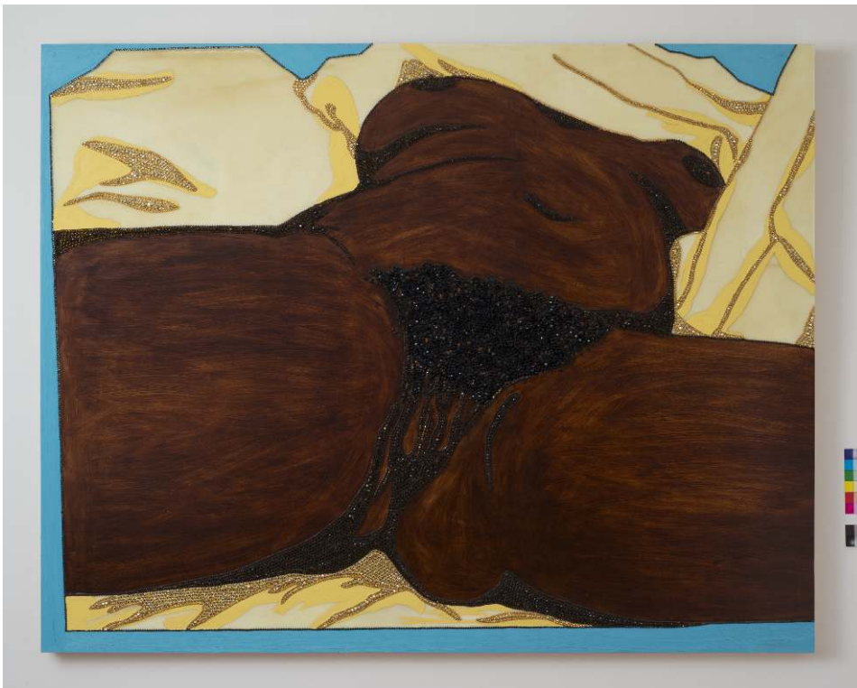
Détail d'un des cadres : Mickalene Thomas, Origin of the Universe I , 2012

En peinture, des matériaux divers sont ajoutés sur le support utilisé. Ainsi en s'appropriant le célèbre tableau de Courbet, symbolique pour sa valeur transgressive, Mickalene Thomas (née en 1971) propose The Origin of the Universe I (2012). Sur le support d'un panneau de bois est peint un décor simplifié : le lit, grossièrement représenté en jaune, apparaît comme abstrait du réel et posé sur un fond bleu uni qui évoque un cadre incomplet. Contrairement au réalisme de l'image de Courbet qui mettait le regardeur en présence de la chair, ce cadre imparfait induit une forme de distance en soulignant la dimension iconique de la pièce et en lui conférant, par son incomplétude dans le coin supérieur droit, un caractère dynamique. Cette distance est derechef soulignée par les strass de couleur utilisés pour représenter les zones d'ombre du tableau original : en jaune celles du lit (plis froissés des draps), et en brun celles du corps féminin (plis de la chair) mais aussi le poil pubien. Le corps de la femme, désormais noire, est reproduit à partir de photographies que l'artiste a prises de son propre corps. Le titre du tableau, The Origin of the Universe I , semble indiquer que cette nouvelle origine englobe en la précédant L'Origine du Monde .