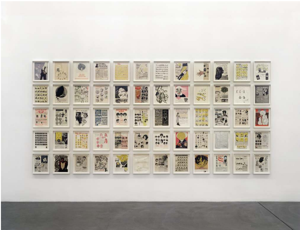
Ellen Gallagher, DeLuxe , 2005