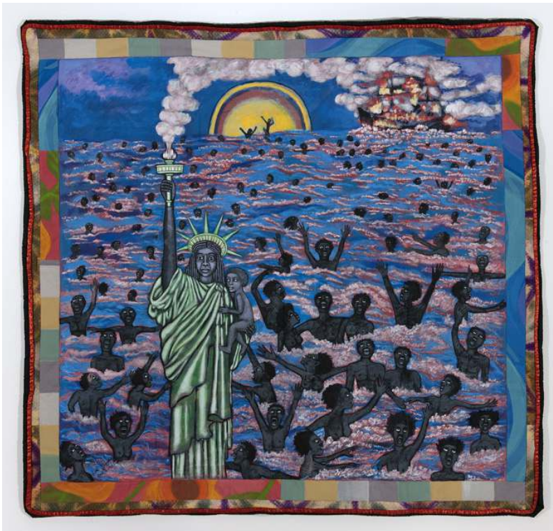
Faith Ringgold (née en 1930). The American Collection # 1 : We Came to America , 1997.

Les trois dernières salles de l'exposition donnent à voir la production artistique depuis la période des années 1960, c'est-à-dire celle qui a accompagné les mouvements pour les droits civiques, jusqu'à aujourd'hui. Il apparaît que, malgré le Civil Rights Act de 1965, ces œuvres d'art continuent d'exprimer une préoccupation politique. En représentant un passé douloureux, elles montrent que faire reconnaître ce dernier demeure de nos jours encore un enjeu. En témoigne l'assemblage de Faith Ringgold (née en 1930), The American Collection # 1 : We came to America (1997).