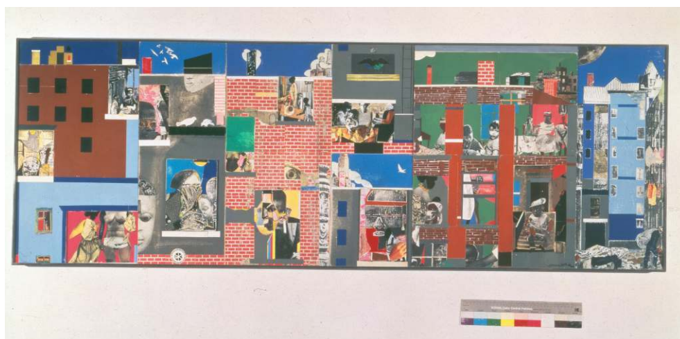
Romare Howard Bearden, The Block II , 1972

En effet, l'hybridité peut être conceptuelle et se manifester par l'assemblage de symboles, comme le montre le U.N.I.A. Flag (1990) de David Hammons. Ainsi, à l'occasion de l'élection du premier maire de New-York africain-américain, l'artiste a produit ce drapeau tissé de coton teint en combinant le drapeau américain et celui proposé en 1920 par l'association créée par Marcus Garvey, l' Universal Negro Improvement Association , pour rassembler la communauté africaine-américaine. L'hybridité peut être bien sûr matérielle et prendre la forme de l'assemblage de matières, matériaux ou objets divers. Cette qualité s'apprécie dès le premier objet exposé, le pot en argile de l'esclave David Drake, rempli de cannes en bois et d'un bouquet de coton. Essentielle aux collages, elle apparaît dans The Block II (1972) pour lequel Romare Bearden (1911-1988) a réuni feuilles d'aluminium, peinture, encre, graphite, sur dix-sept panneaux de fibres et contreplaqué dont il a gratté la surface, en incluant deux panneaux appliqués en relief et un autre plus enfoncé. Il est dommage que le cartel (ni même l'audioguide !) n'indique cette riche composition.