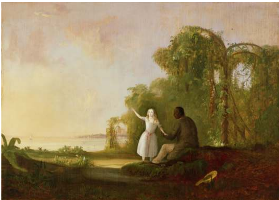
Robert Duncanson, Uncle Tom and Little Eva (1853)