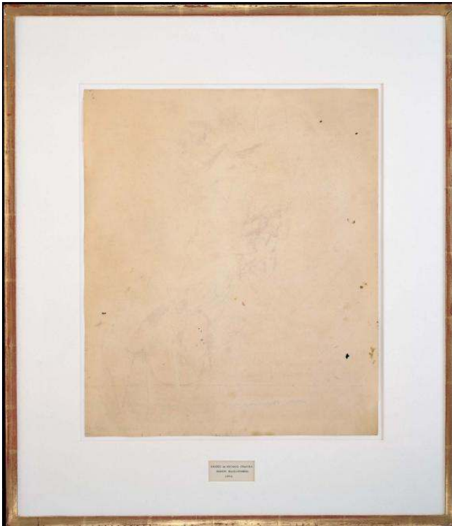
Traces d'encre et de crayon sur papier, 64,1 x 55,2 x 1,3 cm, San Francisco Museum of Modern Art, © 2017 The Rauschenberg Foundation

Robert Rauschenberg, Erased de Kooning Drawing , 1953