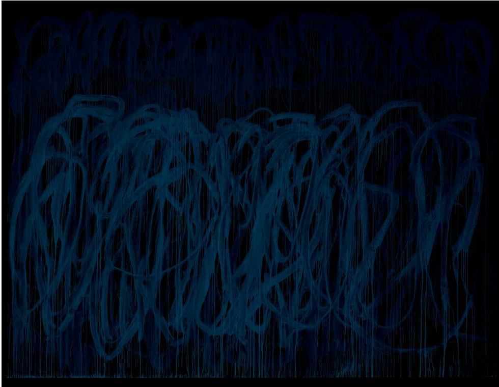
Acrylique sur toile, 317,5 x 417,8 cm Udo et Anette Brandhorst Collection © 2017 Cy Twombly Foundation