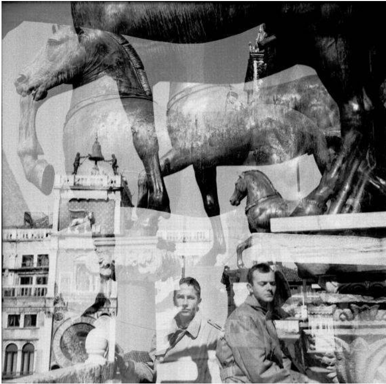
38,1 x 38,1 cm, © 2017 The Rauschenberg Foundation