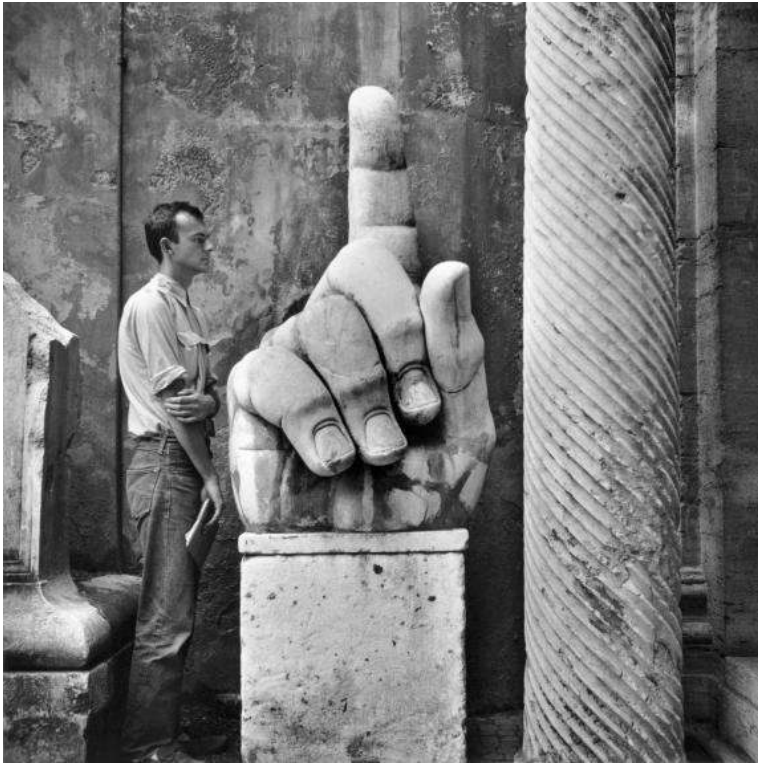
38,1 x 38,1 cm, © 2017 The Rauschenberg Foundation