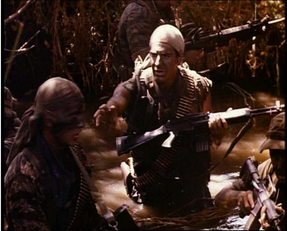
Figure 2 : Sam Beckett en soldat lors de la Guerre du Vietnam (3.2)

américain, à l'exclusion des lectures étrangères de ces conflits. Quelques exceptions sont néanmoins à noter, comme l'épisode centré sur l'épouse japonaise d'un ancien soldat, « The Americanization of Machiko » (2.3).