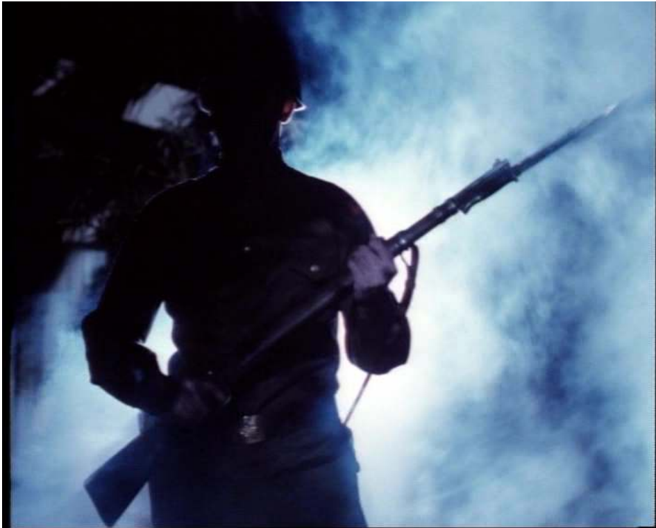
Figure 5 : L'enfant croit voir un soldat (4.11)