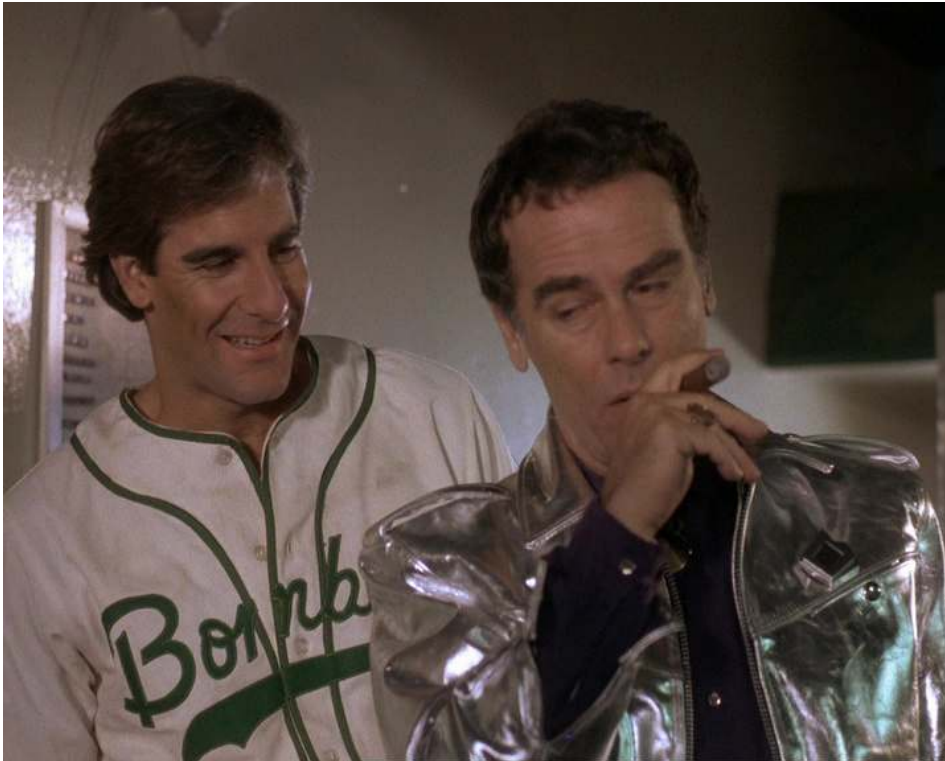
Figure 1: Sam Beckett (Scott Bakula) et Al Calavicci (Dean Stockwell) dans l'épisode pilote