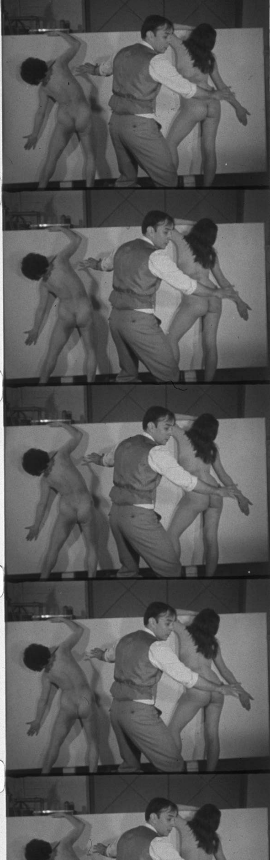
Anthropométrie de l'époque bleue, Galerie internationale d'art contempo- rain, Paris, France, 9 mars 1960