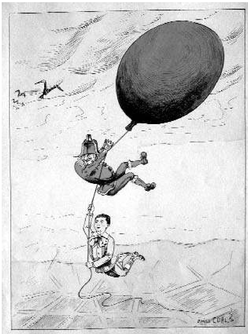
Abel Deparc, Mon ami Polichinelle , dessins d'Émile Cohl, Paris, Jules Lévy éditeur, c. 1897, p. 11