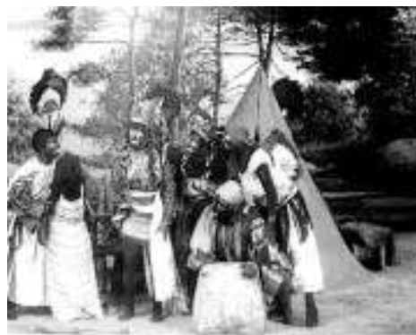
Émile Cohl, le Petit Soldat qui devient dieu (1908)

Polichinelle, qu'il est dès lors difficile de considérer comme « l'ami » désigné par le titre. Fourbe manipulateur au regard aigu, Polichinelle ne convoque l'aventure que pour la faire haïr, et se complaît dans la double posture finale du mentor content de lui, solidement installé dans son fauteuil, et du maître de jeu virtuose qui entend plier le monde et les lettres, celles qui composent le récit littéraire, à sa seule fantaisie – une fantaisie dénuée de fantasy , terne, réaliste et casanière. Polichinelle est l'ennemi désigné de la littérature et de l'imagination. Celle que Cohl, quelques années plus tard, va déployer dans ses films d'animation à la fantaisie débridée.