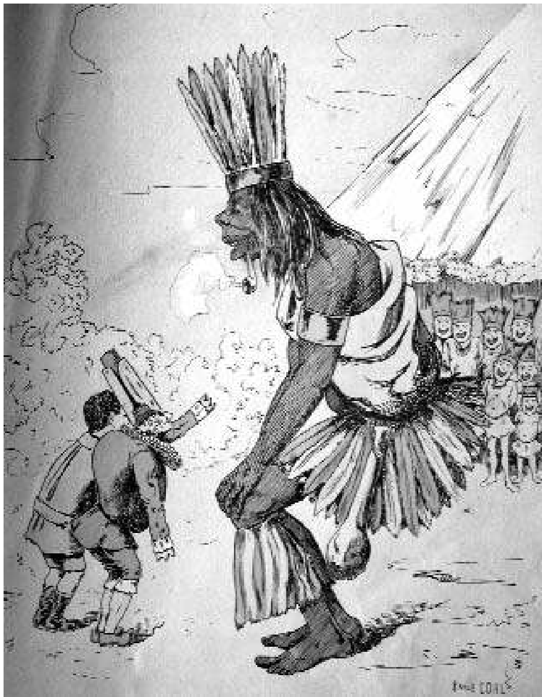
Abel Deparc, Mon ami Polichinelle , dessins d'Émile Cohl, Paris, Jules Lévy éditeur, c. 1897, p. 19