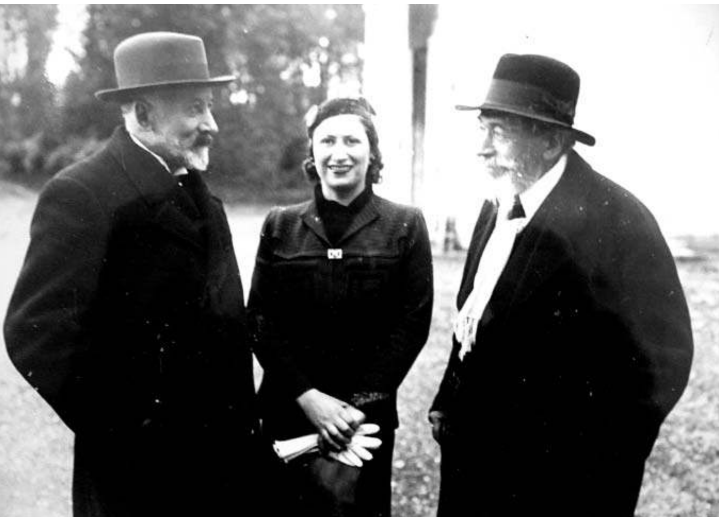
Georges Méliès et Émile Cohl, c. 1937